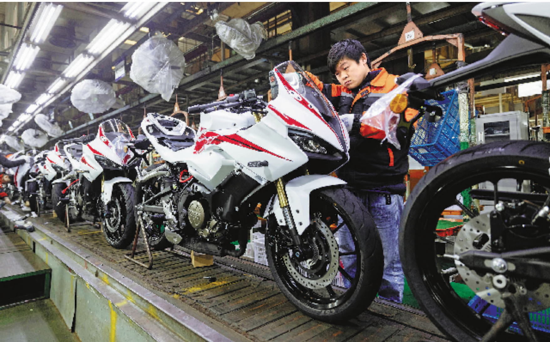
2月7日,温岭市钱江摩托股份有限公司生产车间内,发动机轰鸣声、机械加工声此起彼伏,工人正熟练地操作着设备,开足马力赶订单。