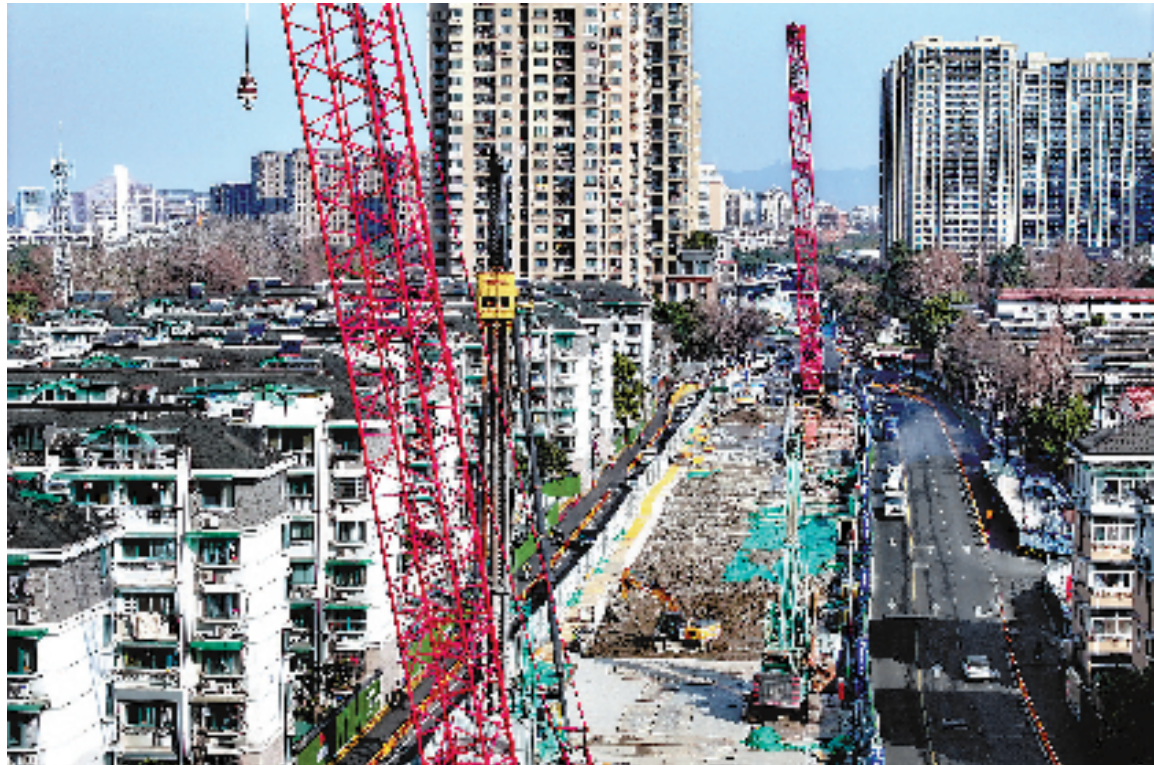
2月7日,杭州地铁华家池站建设工地上热火朝天,吹响新春复工的号角。