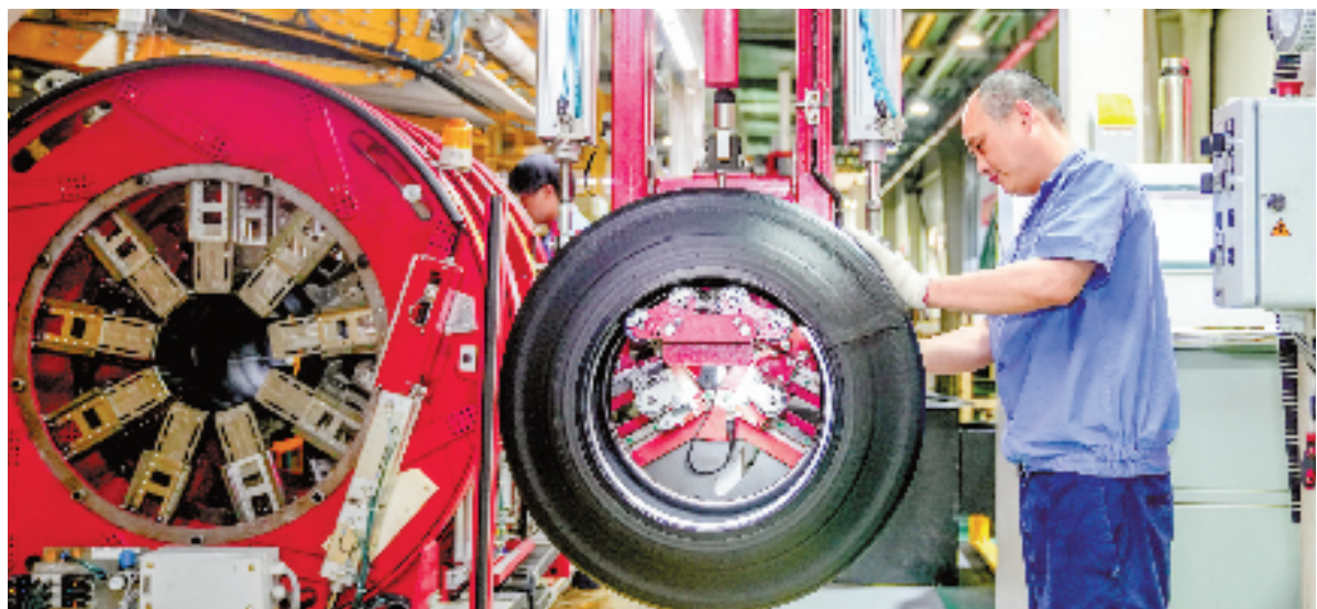
2月7日,建德市下涯镇的中策橡胶(建德)有限公司车间里,一排排机器轰鸣,几秒钟时间,一套轮胎制品就从自动化生产线上下线。

企业车间机声隆隆,开足马力赶订单;建筑工地热火朝天,争分夺秒加油干……随着春节假期的结束,我省各地工程、企业一片繁忙景象,建设者们铆足干劲,全力冲刺“开门红、开门好”,为浙江高质量发展注入强劲动力。记者走进车间、工地一线,用镜头定格火热场景。