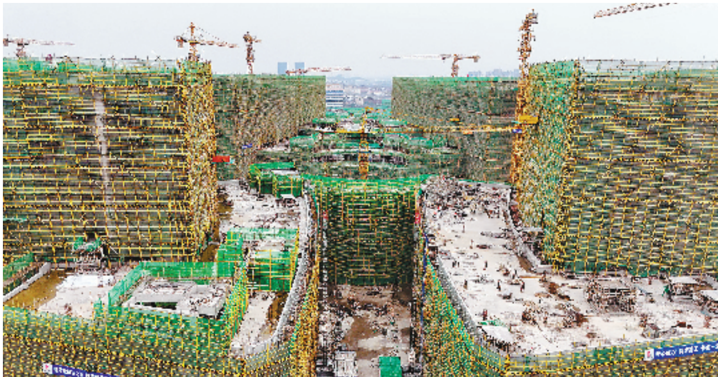
2月6日,金华市金义新区的金华市中心医院新院区项目建设正在如火如荼地进行中。