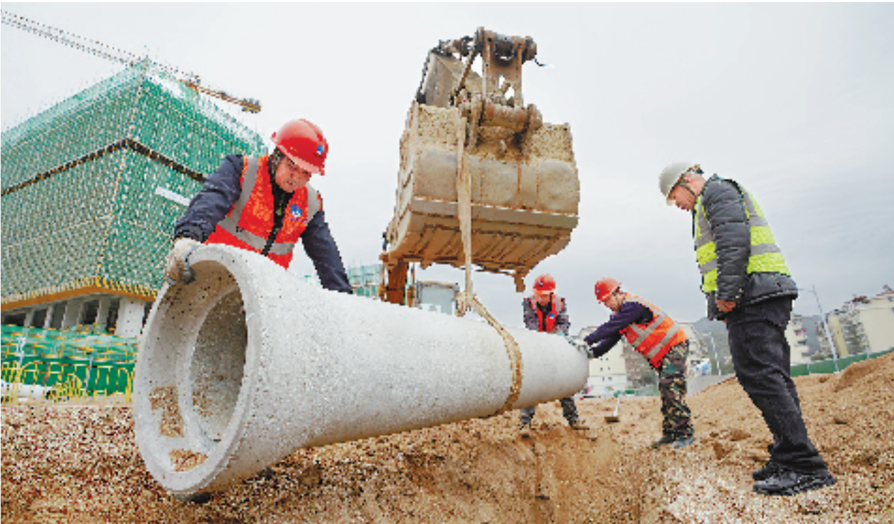
2月7日,景宁畲族自治县浮丘未来社区项目施工现场,工作人员正在加紧铺设雨污管道。