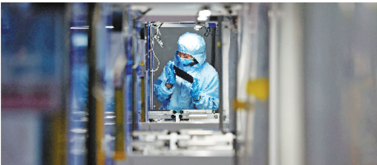
2月7日,在金华市金东区润马光能科技(金华)有限公司智能化生产车间内,技术工人正在赶制光伏电池订单。