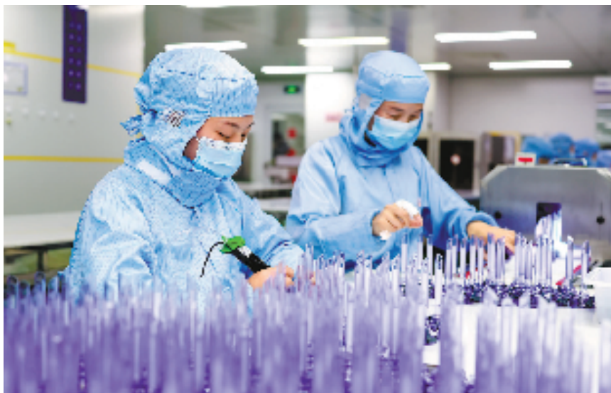
2月7日,在杭州市桐庐经济开发区的杭州康基医疗器械有限公司生产基地里,一派繁忙景象,工人们正在加紧生产一次性套管穿刺器等产品。