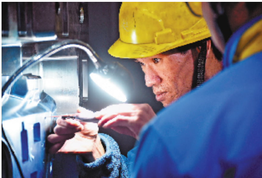
2月6日,宁波明飞科技有限公司宁海生产基地,数控机床切削声与各种马达声汇聚成新春交响曲,工人们在一丝不苟加工模具,让各部件做到严丝合缝。