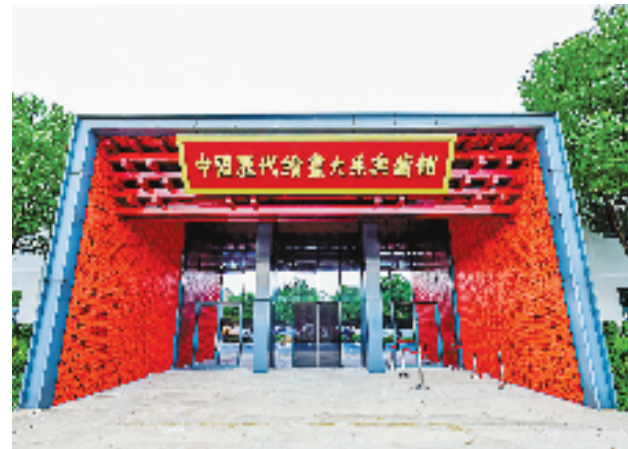
中国历代绘画大系典藏馆