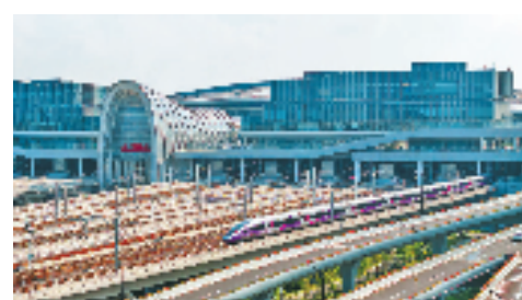
开往温州的复兴号列车从杭州西站驶出

在增强群众获得感满意度方面,余杭深入实施公共服务“七优享”工程,持续推进“美好教育工程”“舒心就医工程”,推动杭州外国语学校余杭校区等项目落地建设,加快浙大妇