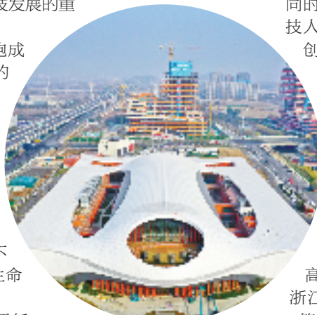
杭州超重力场实验大楼交付使用

推动未来产业再争先。基于现有产业基础,余杭已重点谋划布局人工智能、低空经济、人形机器人、类脑智能等未来产业。接下来,余杭将大力实施“人工智能+”行动,加快智能算力集群建设,培育具有全球竞争力的垂直行业大模型;坚持“空地一体”发展,加快打造国家智能网联汽车“车路云一体化”应用标杆城市核心区,进一步打响“中国飞谷”品牌;打造全国机器人科技创新策源地、产业生态集聚地,争创省级类脑智能未来产业先导区。