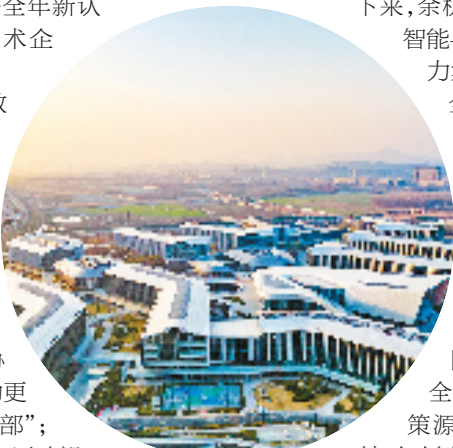
余杭南湖未来科学园