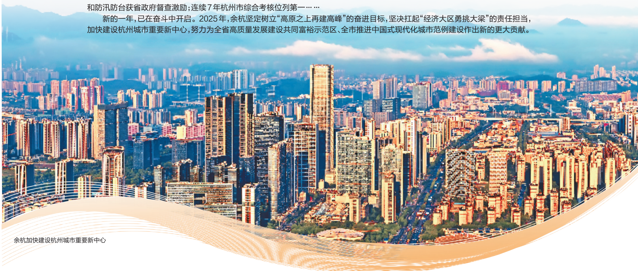
余杭加快建设杭州城市重要新中心

杭州城市重要新中心加速崛起。刚刚过去的2024年,余杭交出了经济社会发展高分报表——继2023年GDP、地方财政收入、数字经济核心产业增加值重回全省第一后,2024年财政总收入也实现超越,四大指标全面重回全省第一,进一步扛起“经济大区勇挑大梁”的责任担当;第二届“良渚论坛”成功举办,“五千年中国看良渚”金名片进一步擦亮;首夺安全发展铜鼎、蝉联科技创新鼎,形成科技创新、生态文明、乡村振兴、安全发展、平安建设“五鼎齐聚”;服务业高质发展、数字经济提质、城乡风貌整治、交通强省建设、金融风险防范、安全生产和防汛防台获省政府督查激励;连续7年杭州市综合考核位列第一……新的一年,已在奋斗中开启。2025年,余杭坚定树立“高原之上再建高峰”的奋进目标,坚决扛起“经济大区勇挑大梁”的责任担当,加快建设杭州城市重要新中心,努力为全省高质量发展建设共同富裕示范区、全市推进中国式现代化城市范例建设作出新的更大贡献。