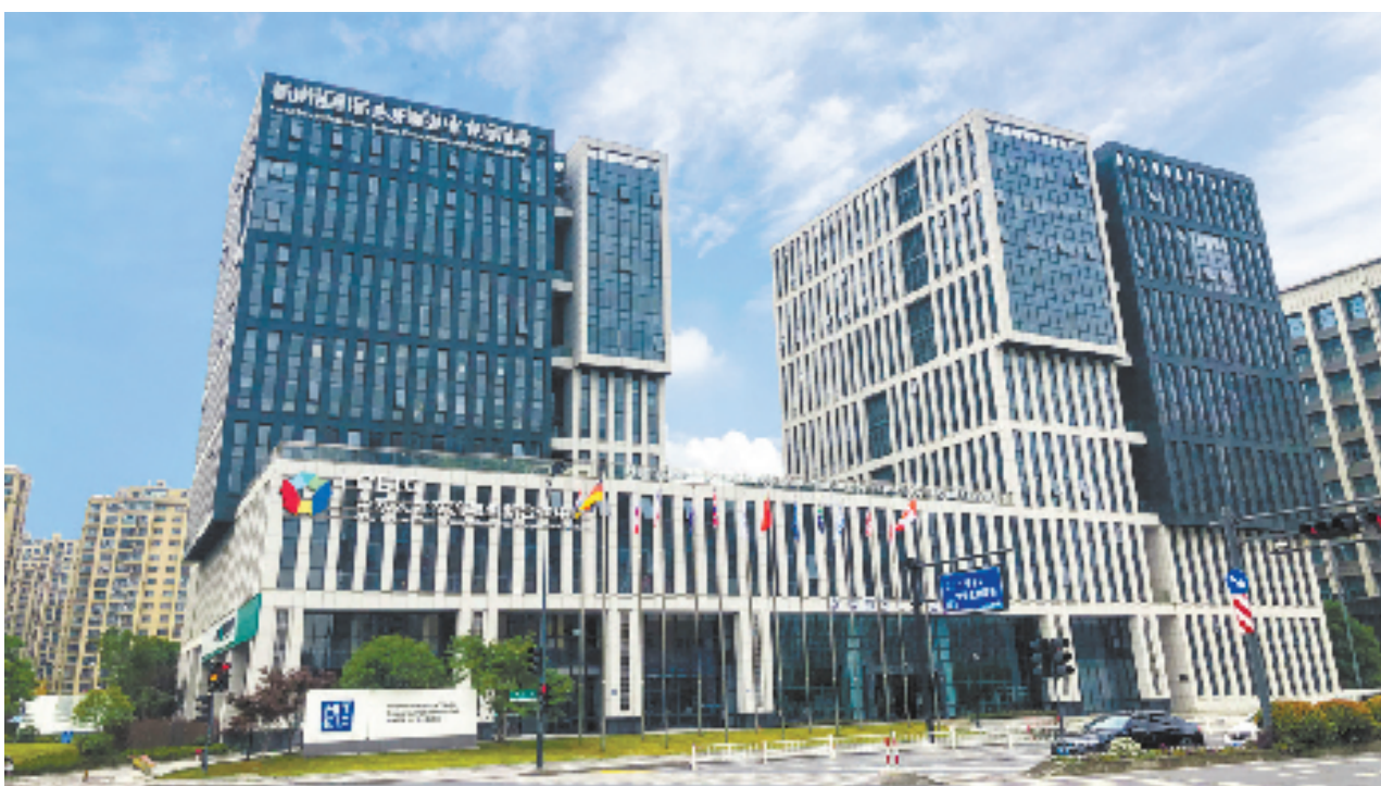
中欧人才交流与合作创新中心拱墅基地

正确用人导向是对干部队伍的最大激励。党的二十届三中全会《决定》强调，要树立和践行正确政绩观，健全有效防范和纠正政绩观偏差工作机制，着力解决干部乱作为、不作为、不敢为、不善为问题。拱墅持续加强干部政绩观全链条管理，突出有效防范和纠正政绩观偏差，用活用好用足职务职级资源，鲜明导向推动干部能上能下，激励干部担当作为。加强“四考合一”与综合考核人考事深度融合，梳理精简一批至关重要、引领性强的核心指标，深