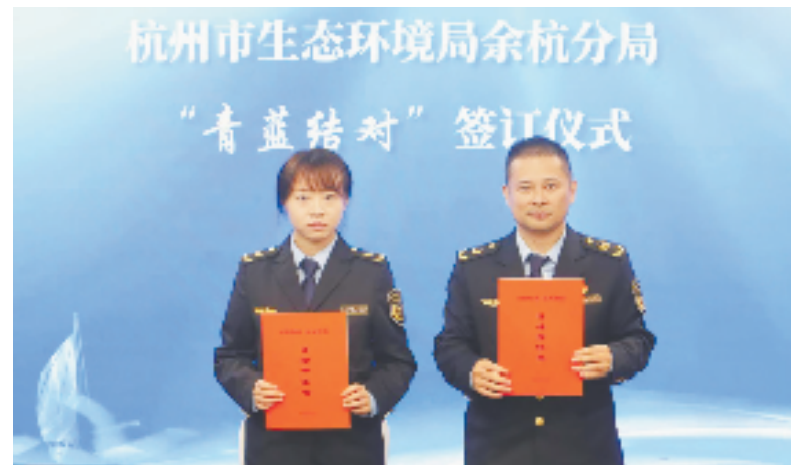
杭州市生态环境局余杭分局举行“青蓝结对”协议签订仪式

下一步，余杭分局将持续推进年轻干部培养行动，打造善作善成的“环保铁军”，进一步实施“党建领航生态聚力”干部能力提升计划等行动，助力青年成长成才，为美丽余杭建设注入源源不断的“人才活水”。