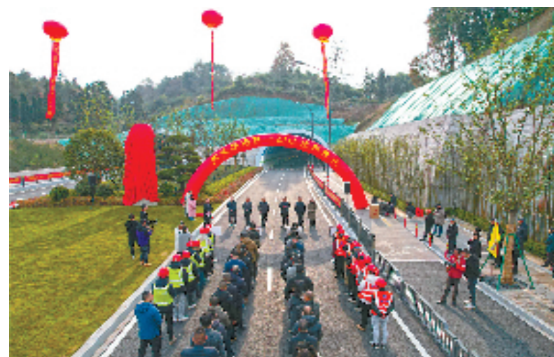
武义解放街南延工程试通车仪式

据统计，今年前三季度，该集团已完成投资19.6亿元，完成融资48.3亿元，同比分别增长117%和185.83%；连续三年投融资总额位居武义县国企第一位。