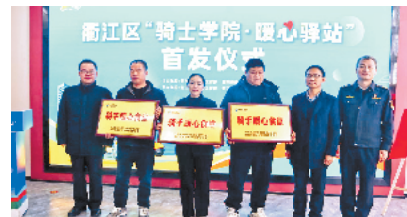
“骑士学院·暖心驿站”首发仪式

作为“骑士学院·暖心驿站”的首发地，东方·红领汇党群服务中心秉持“公共服务提质升级，优质资源开放共享”的理念，科学合理地打造了供骑手休息的“暖心驿站”，24小时不间断提供饮水热餐、休息学习、电瓶充电、健康体检等服务，保障小哥“冷可取暖、热可纳凉、口渴能饮、累能歇