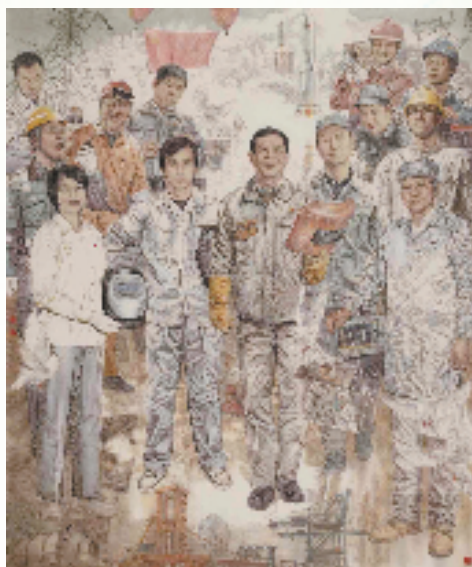
绘画类一等奖获奖作品《大国工匠——奋进新时代》

本次书画展不仅在金华市城市展示馆设置主会场,还创新性地地在义乌国际商贸城、东阳横店影视城外滩景区设立分会场。这种分会场的形式,充分考虑到各地职工的观展便利性,无论身处金华市区,还是在义乌、东阳等地,职工都能就近观展,让更多人领略书画艺术的魅力。同时,线上数字展览也同步开展,借助虚拟现实(VR)技术,打破了时空束缚,为观众带来沉浸式、互动式的全新观展