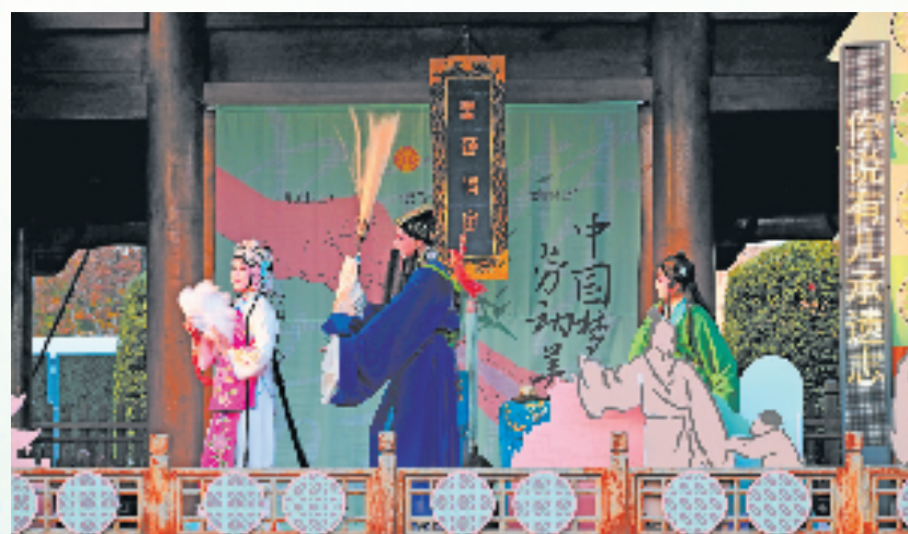
工匠集市婺剧表演

工匠集市不仅是一场传统文化的展示盛会,更是传承和弘扬工匠精神的重要平台。它让古老的工匠技艺走出深闺,走进大众视野,让更多人了解到这些传统技艺背后所蕴含的深厚文化底蕴与工匠的执着坚守。在这里,每一位工匠都是文化的传播者,每一件作品都是精神的传承者,他们用自己的方式诠释着工匠精神的内涵,让观众在欣赏与体验中,对传统文化和工匠精神有了更深刻的理解与感悟。