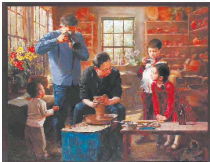
绘画类一等奖获奖作品《延续》