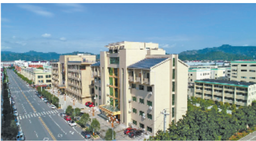
全球最大维生素D 3 生产企业——花园生物公司

不过，以前这些企业很多是劳动密集型，由于缺乏核心技术和自主产品，企业产值一直停留在2亿—3亿元之间。1993年，在多次出国考察后，邵钦祥提出，“必须实施高科技战略，拥有自主知识产权，铸造企业核心技术，才能在市场竞争中有立足之地，赢得辉煌的明天！今后