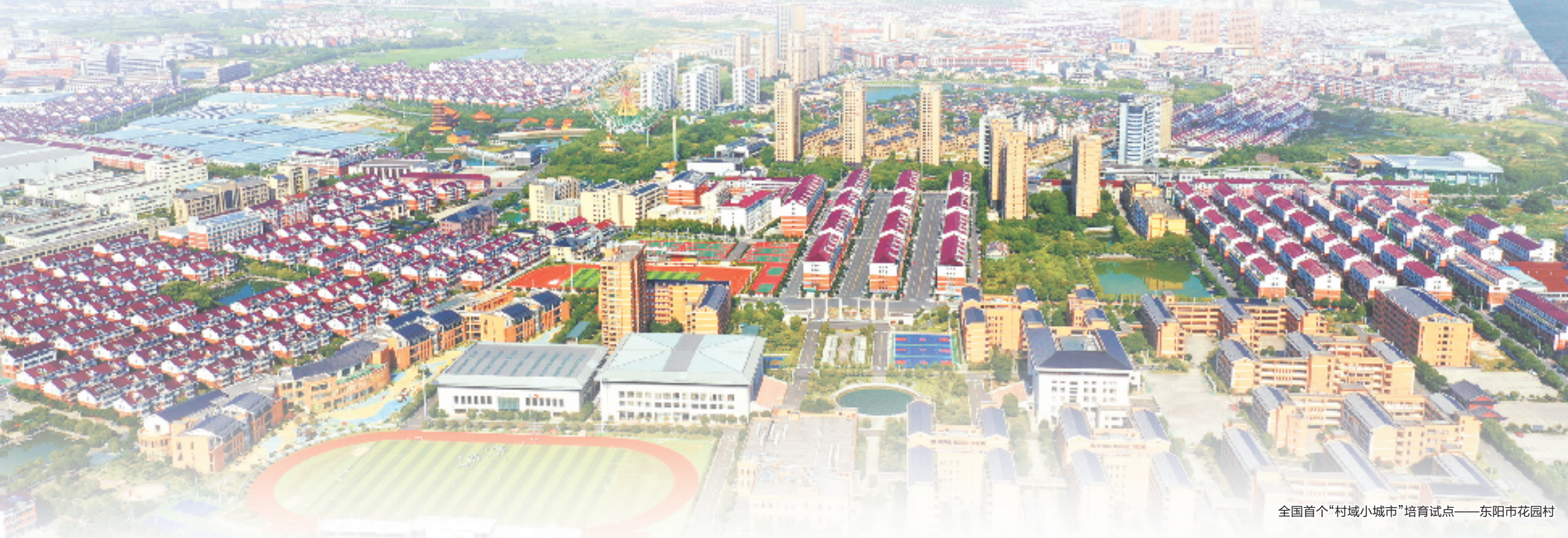
全国首个“村域小城市”培育试点——东阳市花园村

从1981年办服装厂到1993年成立集团，再形成如今的一二三产业多元发展格局；从传统产业起家，转型到科技产业，再跨越到新兴产业——花园集团先后办过100多家实体企业，形态从劳动密集型向高科技、全产业链、新经济转型发展。目前，花园集团拥有五大主导产业，连续名列中国民营企业500强、中国制造业500强、浙江省百强企业等榜单。今年前三季度，花园集团实现营业收入408亿元，同比增长16.23%，继续保持良好发展势头。