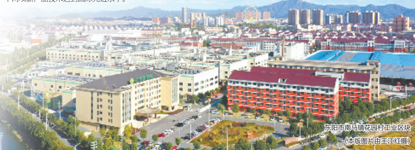
东阳市南马镇花园村工业区块