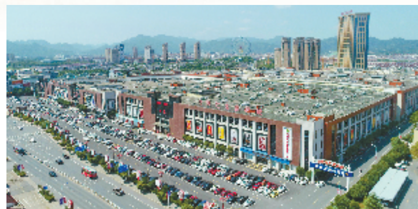
全球最大红木家具专业市场——花园红木家具城