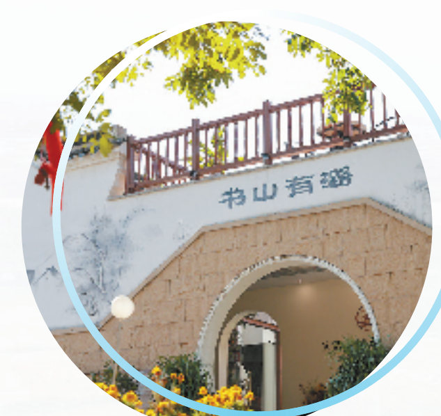
湖州市第一家乡村书店——湖州三联书店“书山有路”

同时,八里店镇也具备承接产业外溢的优势,聚焦“高铁经济”和G60科技走廊,将接沪融杭联苏作为承接产业和人才的重点战略,推动规划、平台、项目三箭齐发,以更加开放的姿态和务实的行动,为打造虹桥国际开放枢纽“金西翼”的目标贡献力量。