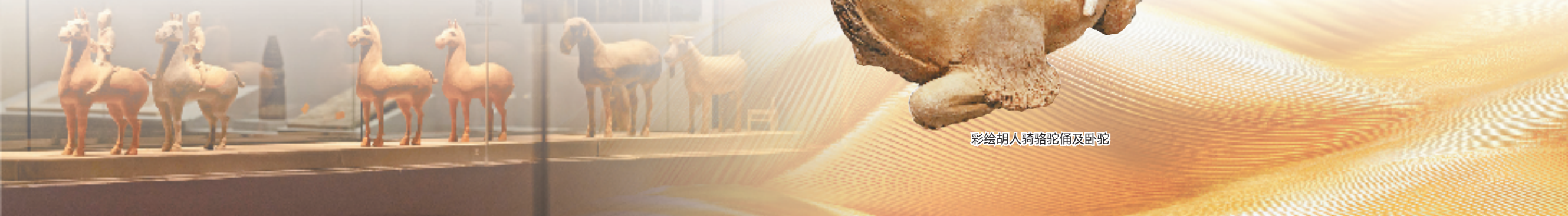
彩绘胡人骑骆驼俑及卧驼