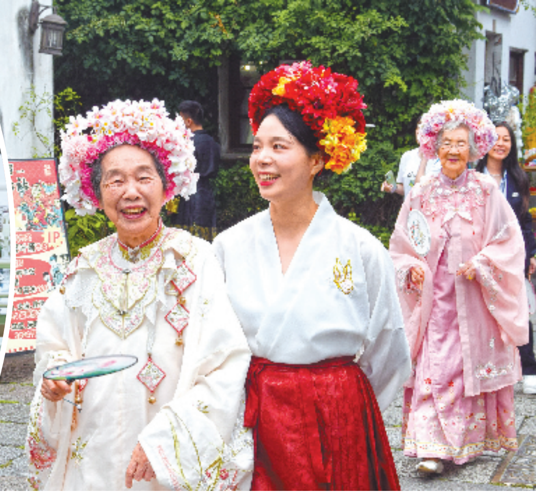
右图:杭州市社会福利中心组织端午节活动,老人和年轻护理员合照。