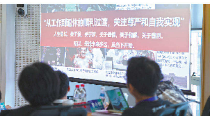
浙江大学管理学院银发经济创新创业人才训练营现场。