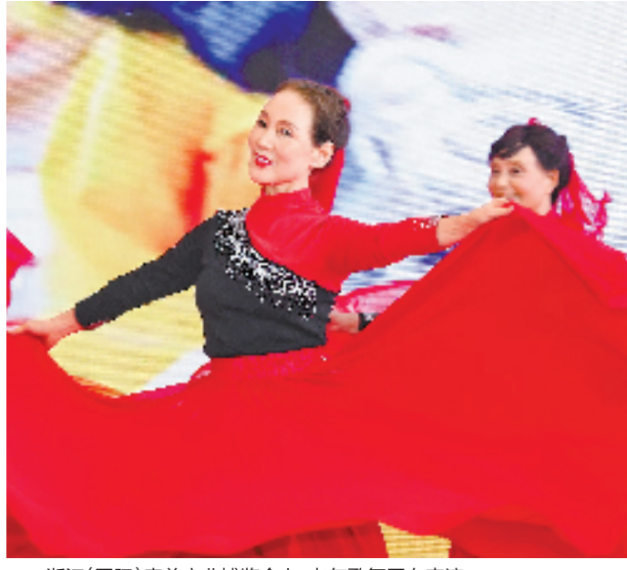
浙江(国际)康养产业博览会上,老年歌舞团在表演。