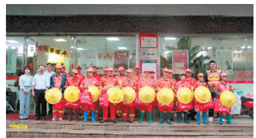
户外劳动者驿站活动

“未来，缙云县将持续发力、全面深化改革，全方位保障劳动者权益，为构建和谐美好的劳动环境添砖加瓦。”缙云县总工会相关负责人说。