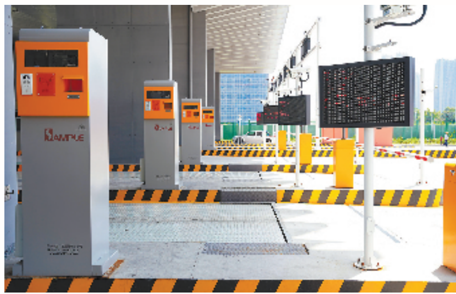
杭州综保区持续优化通关环境

推动“一带一路”沿线国家进口商品超市落地、打造各大进口平台全国性或区域性“退货中心仓”、在无纸化贸易、跨境数据流动、跨境数字贸易司法服务等方面先行先试……新的一年，找准高水平对外开放的着力点和突破口，杭州综保区将持续锚定综保区稳进提质，持续提升通关便利性，探索“保税+”业态延伸，持续优化跨境电商生态圈，推动优质产业和人才项目集聚，培育对外开放新动能，在扩大开放上续写新篇章。”杭州综合保税区管理办公室主要负责人说。