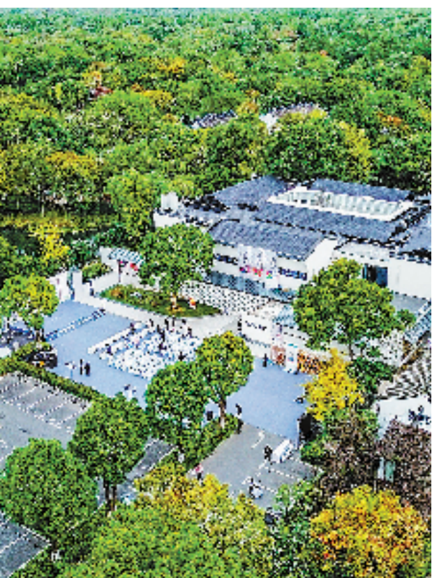
西溪蔡志忠美术馆。

上个月,西溪蔡志忠美术馆正式对外开放。“我想把自己最重要的东西都留在杭州。这个美术馆除了放画,我还希望能够在杭州办讲座,教小朋友画画。我希望这是一座活态的博物馆,能把文化很好地传承下去。”蔡志忠一边说着,一边走到桌子前拿起画笔快速画了几笔,一只圆润可爱的小猫瞬间跃然纸上。