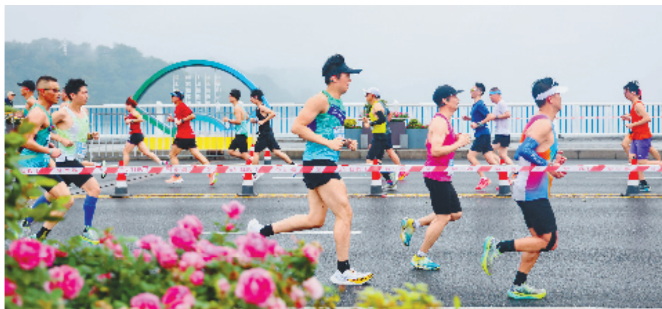
2024桐庐半程马拉松吸引了14000余名跑友跑进诗乡画城。 本报记者 姚颖康 拍友 黄强 摄