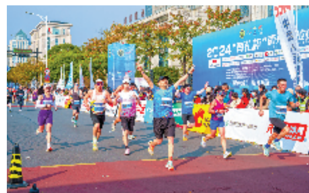
2024衢州马拉松开赛,两万多名马拉松选手用奔跑感受千年古城的独特魅力。