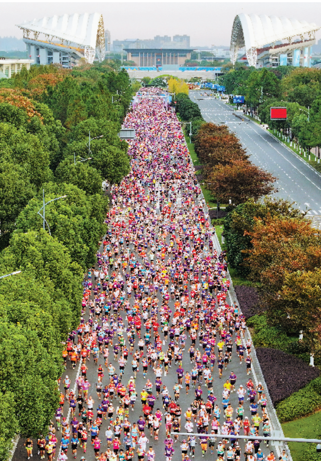
2024嘉兴马拉松鸣枪起跑,20000名国内外参赛选手用脚步感受水乡的浪漫婉约。

进入秋冬季,浙江各地马拉松赛事如火如荼,掀起跑步热潮。仅11月24日一天,全省就有6场马拉松赛鸣枪开跑,来自全球数以万计的参赛选手热情高涨。后亚运时代,马拉松不断焕发出全新活力,在奔跑中见证城市与时代的发展进步。今年上半年,浙江共举办200人以上规模路跑越野赛事和活动超170场,参与人次超37万,均创浙江历史同期最高纪录。其中,最为人们熟知的马拉松,浙江相关赛事数量连年居全国第一。不同的赛道,不同的城市,但同样的热情,一场场马拉松让大家跑遍浙江山水,领略美丽风情。