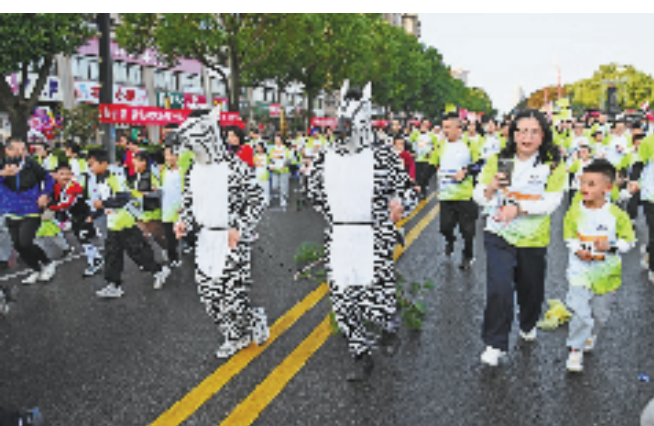
2024横店马拉松以数万人打造的“速度与激情”向电影致敬。