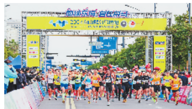
2024舟山群岛马拉松在舟山市普陀区激情开跑,来自全球1.5万名跑友齐聚舟山,领略海岛风光。