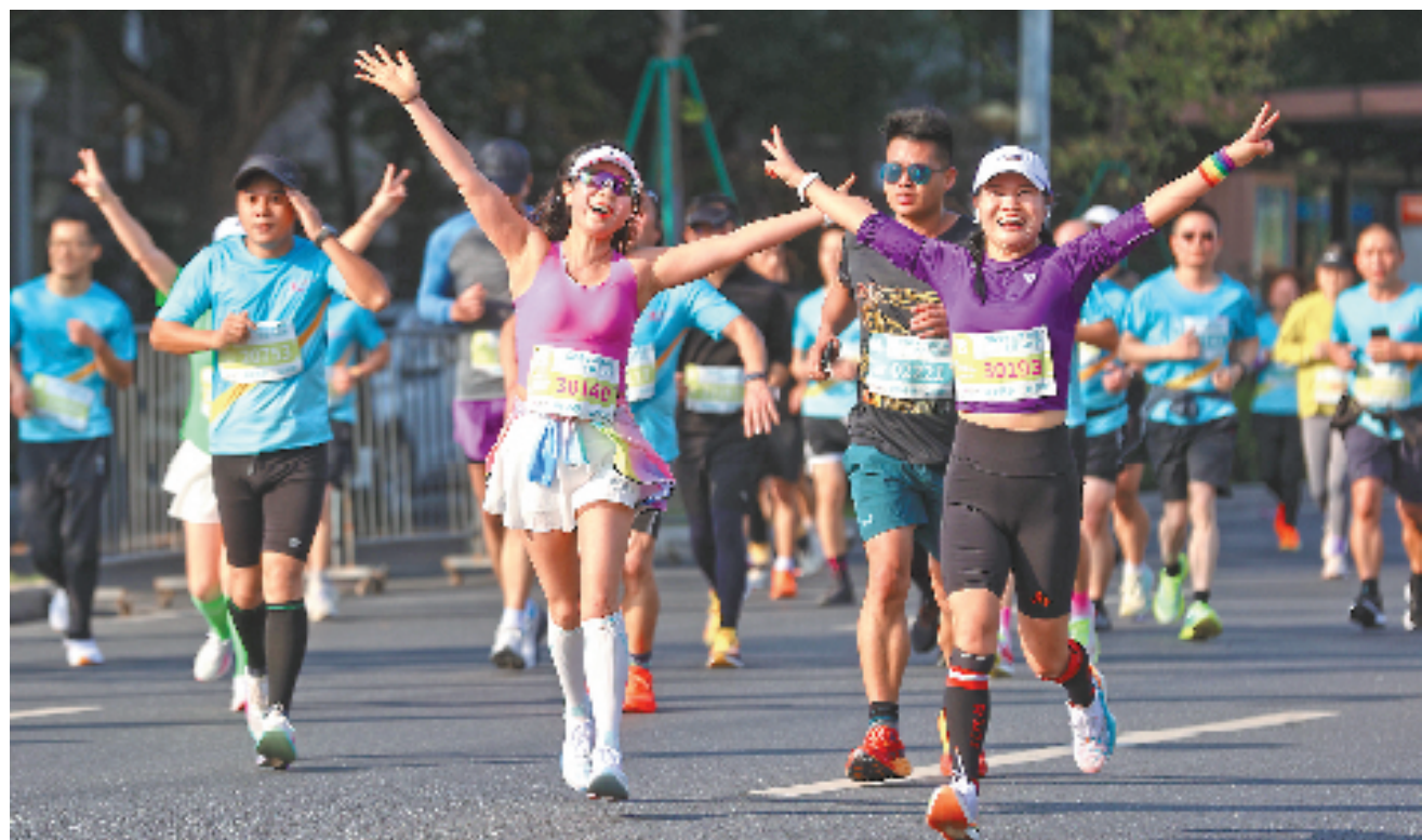
2024诸暨西施半程马拉松比赛现场,元气满满的参赛选手。