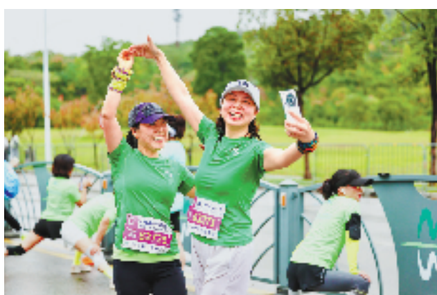
2024湖州马拉松赛在长兴县太湖龙之梦乐园举行,完赛后,参赛者在一起合影留念。