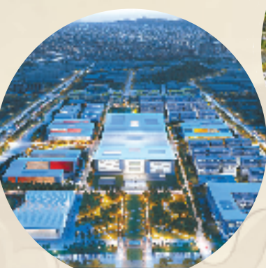
杭州北航国际创新研究院