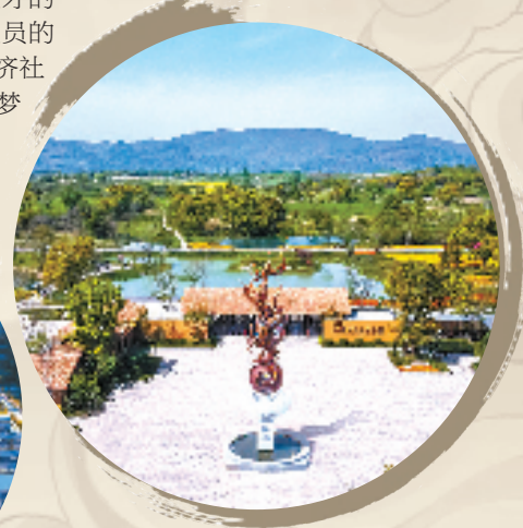
良渚古城遗址公园