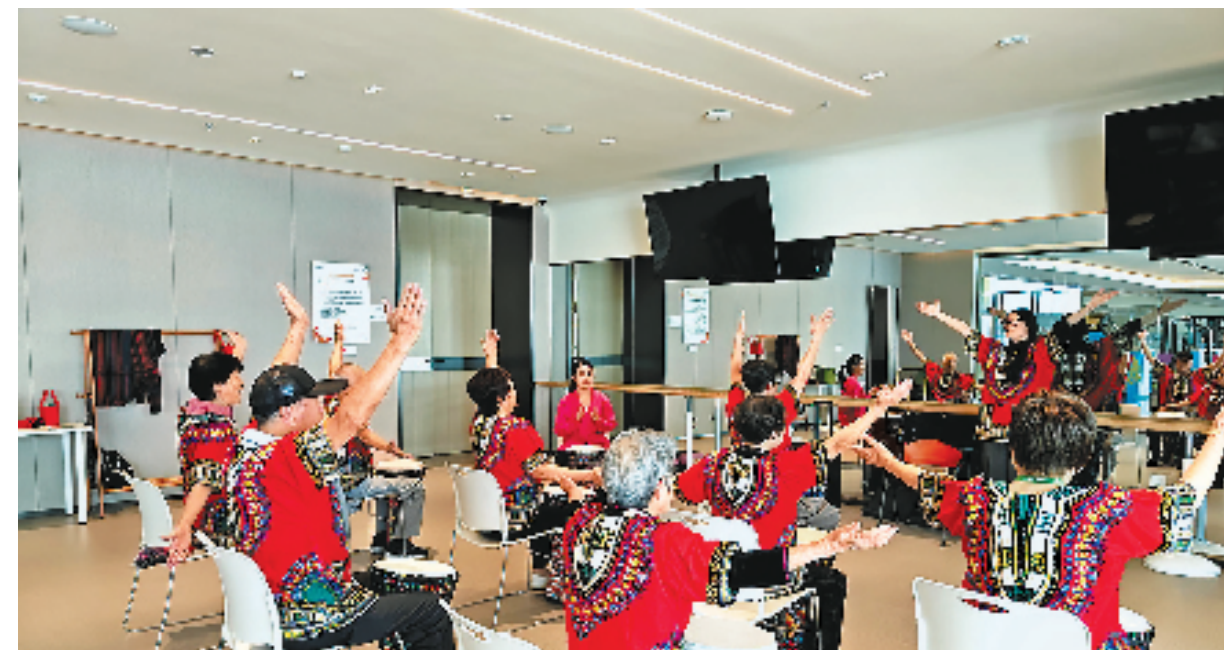
瓯园社区的非洲鼓课程。