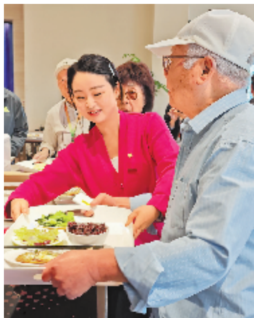
记者(左)帮助老人取餐。