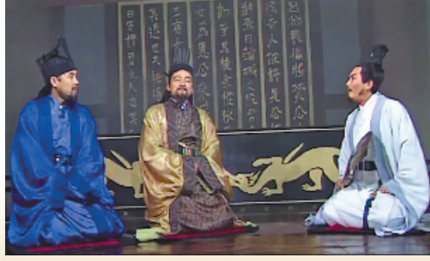
1994版电视连续剧《三国演义》中的张昭(中)和诸葛亮(右)、鲁肃形象。