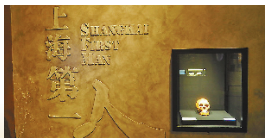
展厅内复原的“上海第一人”。

“考古学者们都认为崧泽文化是一个非常具有特色、思想非常活跃的阶段，比如崧泽文化的陶器，种类丰富，造型富有创造性，这说明文明化开始于这个阶段是有它的基础的。崧泽文化是文明化的