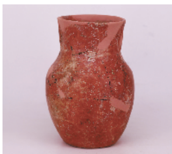
义乌桥头遗址出土的彩陶。

上山文化是世界稻作文化的起源地，是以南方稻作文明和北方粟作文明为基础的中华文明的重要起点。上山文化万年水稻起源、发展的证据，是对世界农业起源认识的一次重要修订。