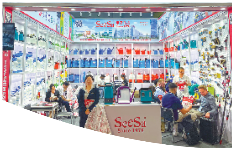
2024年春季广交会现场,市下控股工作人员与客户洽谈。