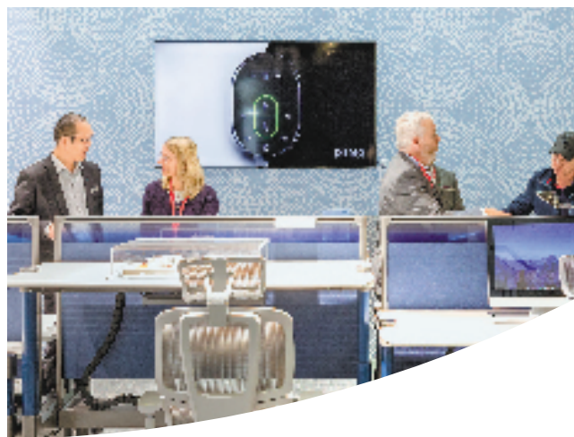
2022年德国科隆展上,圣奥营销人员与客户交流。