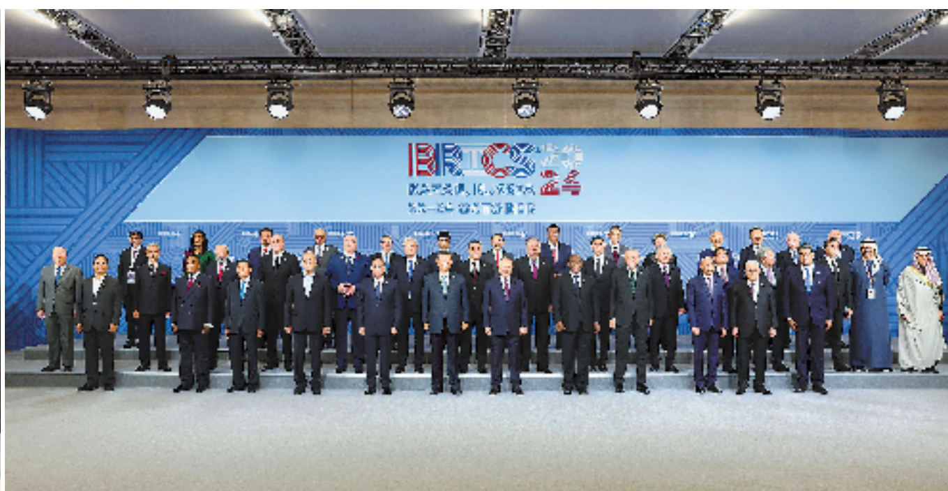
当地时间10月24日上午，国家主席习近平在喀山会展中心出席“金砖+”领导人对话会并发表题为《汇聚“全球南方”磅礴力量 共同推动构建人类命运共同体》的重要讲话。这是出席对话会的金砖国家及嘉宾国领导人或代表、国际组织负责人集体合影。