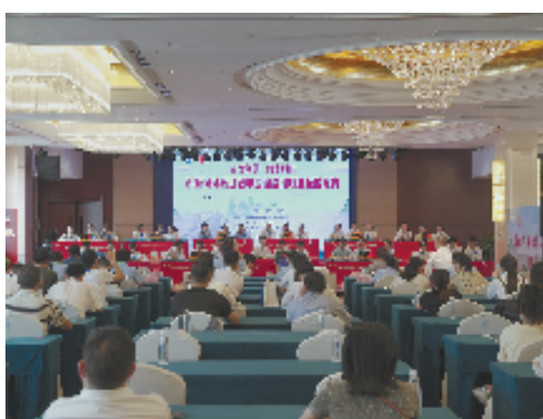
2024年浙江省中药材鉴别职业技能竞赛

省食药检院从体制创新入手,将服务发展、成就人才作为使命和追求,充分激发各类人才活力。以实干为导向来优化选人用人指标体系。2020年,选拔4名高级技术人才直接担任中层正职;2021年公开选聘15名青年主管;2022年选拔任用4名业绩突出的青年干部,打破职务晋级“隐形台阶”;在职称评选和晋升通道方面,破除唯学历、唯资历、唯论文、唯奖项的“四唯”,将品德、能力、业绩等多元标准列为考评内容。同时,还为业绩突出的高层次人才开辟了“绿色通道”“直通车”,形成正向的人才选拔激励氛围。