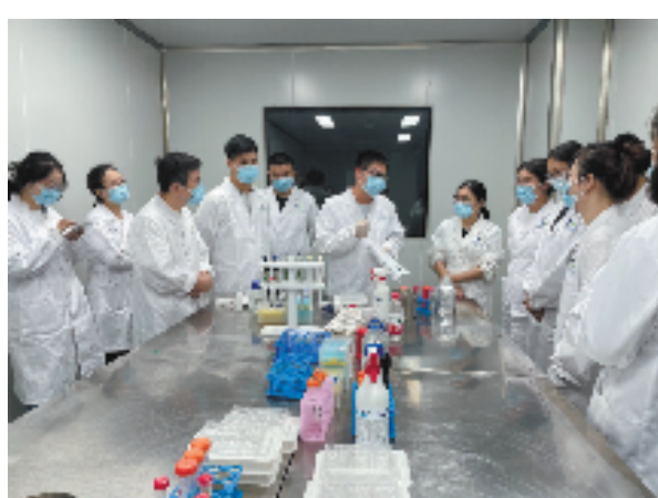
省食药检院“浙里药远航”培训活动现场

省食药检院先后组建了7个省部级重点实验室,为人才的发展提供了坚实的硬件保障基础。据省食药检院相关负责人介绍,近年来从这些实验室里“走出来”的相关成果先后获得“国家科技进步二等奖”1项、“省科技