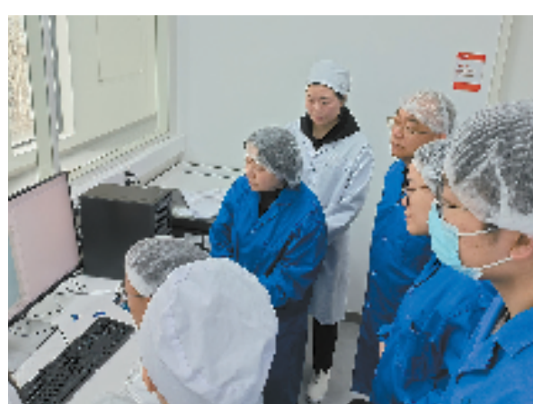
专家赴企业开展技术交流

对于医药行业而言,国际化的视野和交流学习是让人才成长与提升的快速路径。为此,省食药检院派出多名青年骨干前往国际知名机构和高校,通过项目合作开展药品高端制剂研发、化妆品质量安全创新研究,尤其是化妆品动物替代试验技术相关研究更是走在国内前列。同时,派员赴世