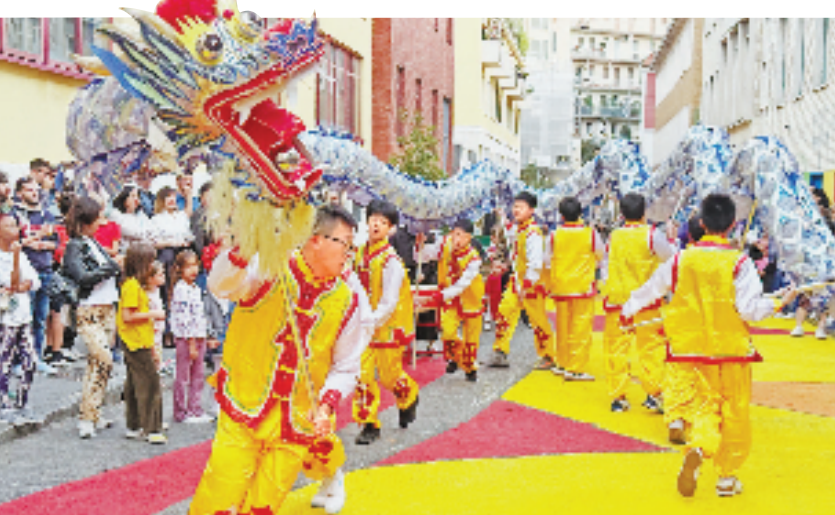
舞龙表演亮相意大利米兰街头。