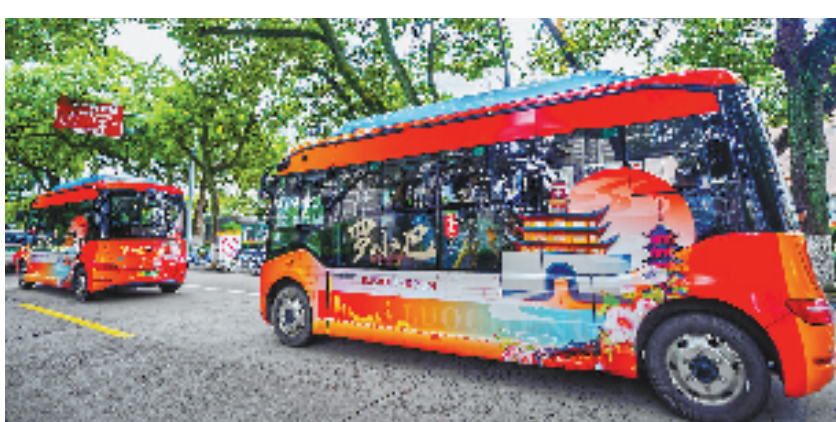
全新亮相的“罗小巴”。