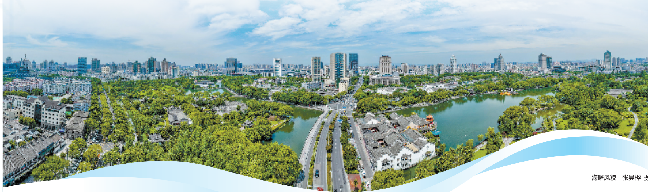
海曙风貌

改革航程波澜壮阔、气象万千。宁波海曙区坚持群众期盼什么、改革就推进什么,让发展成果更多更公平地惠及人民群众——从现实需要出发,从最紧迫的事情抓起,谋划提出聚力突破的攻坚性改革,推动改革向更加注重系统集成、整体协同、全面深化跃升。近年来,海曙区坚持改革破题、机制破难、行动破局,累计开展国家级改革试点4项、省级改革试点52项,交出了一份产业焕新、空间焕新、治理焕新的高质量发展答卷。锚定“十四五”末GDP总量迈进2000亿元的目标,海曙将进一步扛起改革担当、激扬改革锐气,对标对表、攻坚突破,努力为宁波“争一流、创样板、谱新篇”作出更大贡献。