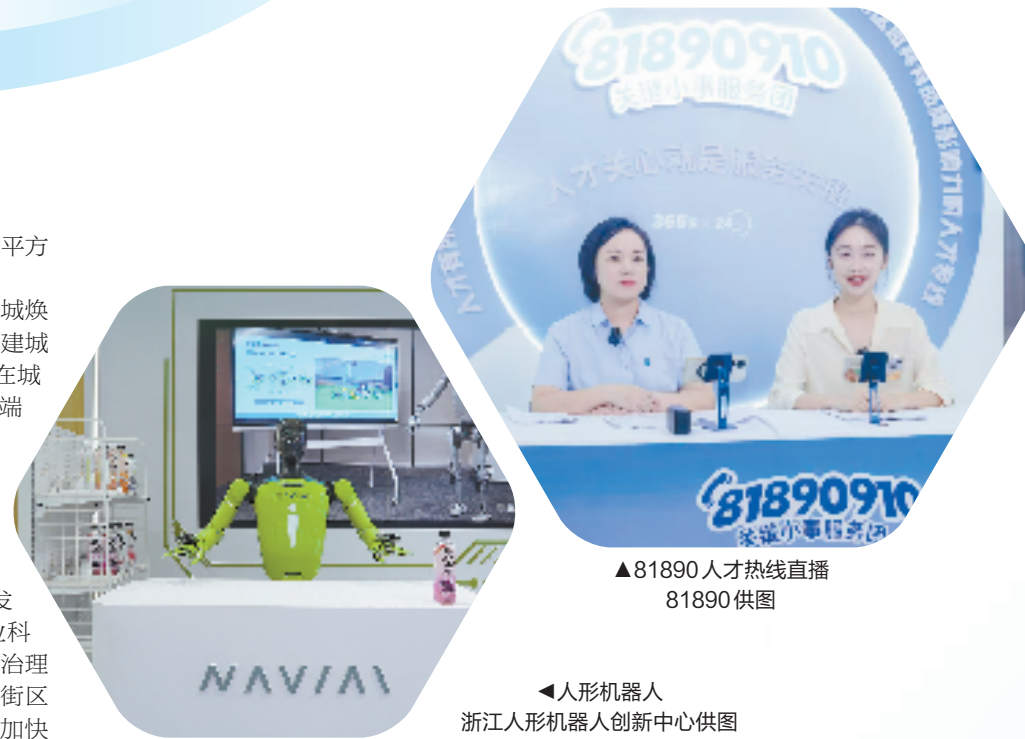
人形机器人

空间,全区已盘活都市空间近10万平方米。在海曙区有关负责人看来,老城焕新意味着城市发展逻辑从“空地上建城市”变成了“城市上建城市”,他们在城市空间焕新中着重引入产业链顶端的研究力量,发展新质生产力。以健全因地制宜发展新质生产力体制机制、统筹推进教育科技人才体制机制一体改革等为抓手,把支持全面创新能力更加突出的位置,从“三侧”发力来培育和发发展新质生产力。公司侧,强化企业科技创新主体地位,推动技术体系和治理模式优化。政府侧,以翠柏里创新街区为牵引,集聚导入各类创新因子,加快形成“街区孵化—载体加速—园区投产”的创新矩阵,超常规力度建设“三支队伍”,建立以创新能力、质量、实效、贡献为导向的评价体系。社会侧,进一步营造氛围,让支持创新、鼓励创新成为全社会共识。