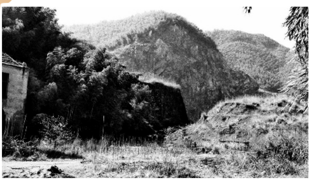
首提绿水青山就是金山银山理念 2005年8月15日,时任浙江省委书记习近平到湖州市安吉县余村调研。当听到村里下决心关掉了石矿、停掉了水泥厂,习近平给予了高度肯定,称这是高明之举,并首次提出“绿水青山就是金山银山”的科学论断,鼓励余村要坚定不移地走生态经济这条路子。如今,安吉余村的故事,已经为世人熟知、传颂。 左图:矿山开采时期的余村旧貌(资料照片)。右图:俯瞰如今的余村。拍友 潘学康 摄