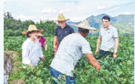
省农科院专家带队指导开化县马金镇大豆种植管理