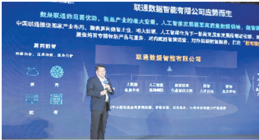
中国联通数据智能有限公司成立