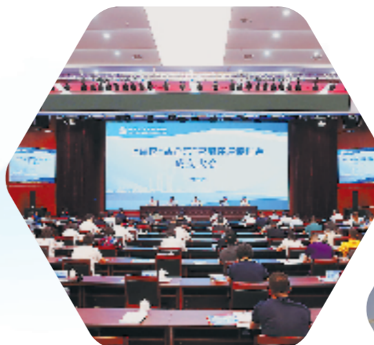
上虞“益企来”营商环境促进会成立大会