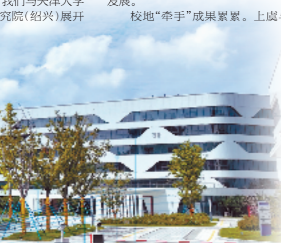
天津大学浙江研究院（绍兴）