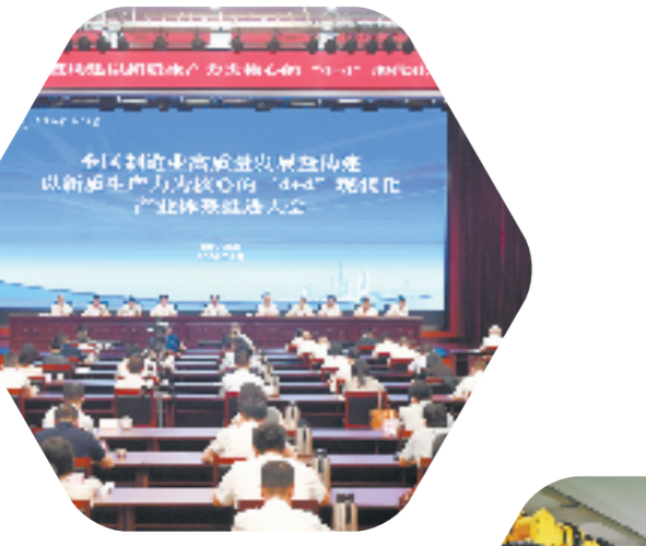
2024上虞区“4+4”现代化产业体系推进大会

当前的上虞，处在又一个“爬坡过坎、赶超跃升”的关键期，亟待进一步全面深化改革，坚持好、运用好“八八战略”蕴含的立场观点方法，积极探索“创改开”一体推进的新格局、新体系、新机制，不断增强上虞高质量发展体制机制新优势，形成更多具有上虞辨识度、推广价值的标志性成果，书写中国式现代化上虞实践的万千气象。