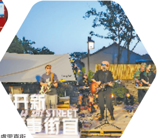
融“古老”和“年轻”于一体的上虞里直街