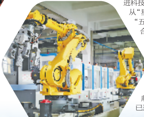
卧龙电驱未来工厂