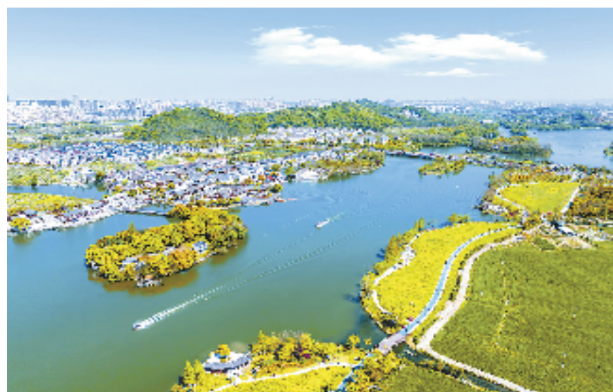
鉴湖国家旅游度假区

其中绍兴仓桥直街的保护利用工作经验，可谓是古城和文化遗产保护的“教科书”，已在全省历史文化名城名镇村