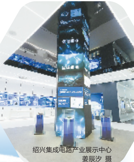
绍兴集成电路产业展示中心

在设备更新领域，绍兴充分利用全省唯一的制造业内生项目专项政策，将企业技改补助幅度提升至10%—16%，有效激发了企业自主更新设备的积极性。截至目前，绍兴已推进省级重点技改项目550个，为产业转型升级奠定了坚实基础。