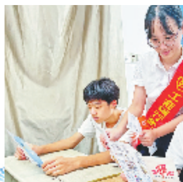
工行金华分行工作人员走进校园,宣传反诈知识。

该行组建金融服务小分队,积极开展“进社区、进农村、进企业、进乡镇”等系列专项大行动,并携手金华市公安局、市中心医院等兄弟单位,通过悬挂横幅、发放折页、现场讲解等多种方式,重点针对老年人等人群,普及金融安全知识,帮助他们深刻认识当前电信网络诈骗高发的严峻态势,提醒大家重点防范养老服务等行业领域打着“以房养老”“健康养老”等名义、以“高利息、高回报”为诱饵而实施的非法集资活动。贴心服务不仅赢得了客户的赞誉,更彰显了金融机构的责任感和担当精神。