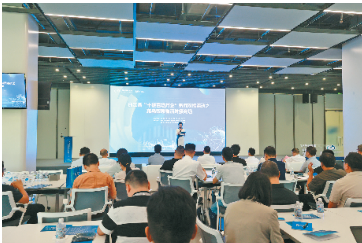
菜鸟智慧物流对接专场

今年以来,省经信厅以“十链百场万企”系列对接活动为抓手,围绕重点产业链优化升级,进一步发挥大企业引领带动作用,推动更多“专精特新”中小企业融链发展、强链支撑,促进产业链供应链上下游、大中小企业融通创新,取得了积极成效,今年已对接订单600.7亿元,融资459.9亿元,达成项目合作606个,成为推动产业链上下游供需对接的标志性平台。