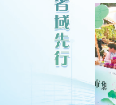
农行金华分行工作人员走进集市宣传