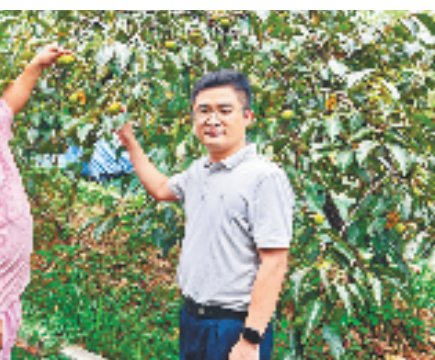
民泰银行金华分行工作人员走访农户

坚持“金融为民”,秉承“普惠金融”的服务理念,邮储银行金华市分行持续优化金融服务流程,创新金融产品,为当地企业和居民提供更加优质、高效、便捷的金融服务,切实维护金融消费者合法权益。邮储银行金华市分行辖内34家自营营业网点和181家代理营业网点作为宣传主阵地,通过设置宣传展板、发放宣传手册等方式开展宣传活动。同时,组织宣传小分队深入社区、商圈、企业、乡村、学校等人员聚集场所开展针对性金融知识宣传活动。特别是在反诈宣传方面,该行联合当地派出所、商户等开展驻点宣传,编排小品演绎诈骗案例,有效提升公众的防骗意识和能力。