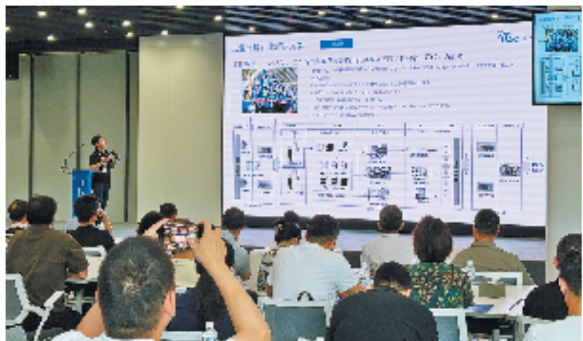
活动现场,企业发布技术解决方案。