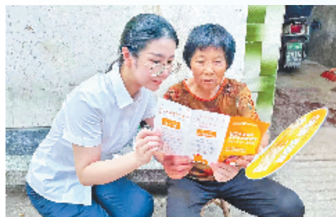
温州银行金华分行工作人员宣讲金融知识

宣传月启动以来,温州银行金华分行通过进农村、进社区、进校园、进企业、进商圈的“五进入”活动形式,将反诈宣传的阵地延伸至村镇社区,打通金融教育宣传“最后一公里”,用实际行动为居民筑起一道坚实的金融安全防线。