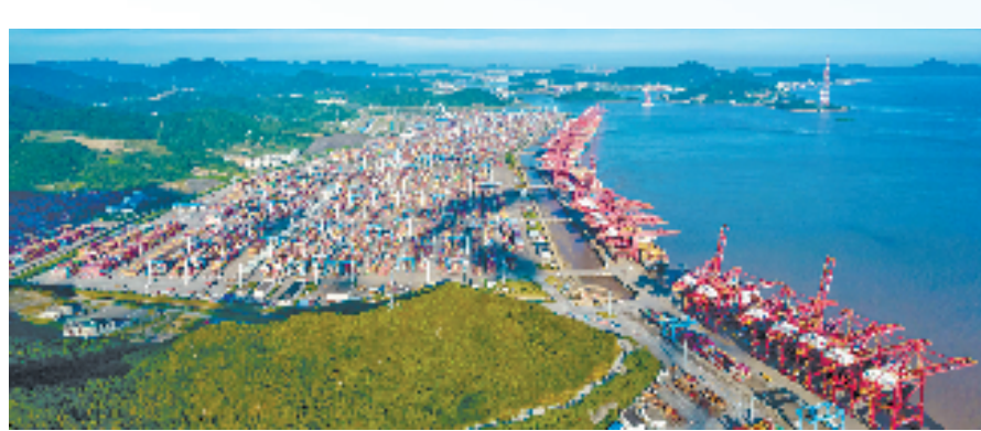
宁波舟山港穿山港区集装箱码头

同时,省国资委正在探索建立国有企业履行战略使命评价制度,“一业一策、一企一策”完善功能价值评价体系和分类考核评价制度,进一步加强主责主业和投资管理,推进重点领域战略性重组和专业化整合,引导国企立足功能使命,提升功能价值,当好长期资本、耐心资本、战略资本,高水平实现经济属性、政治属性、社会属性有机统一,更好服务重大战略和经济社会发展。 重大项目是推进重大战略、落实重大任务的重要载体。近年来,省属企业聚焦主责主业投资实体经济、投重点产业,建成交通、能源、先进制造、科技创新等领域一批重要基础设施项目、重大产业项目。下一步,将以深入实施扩大有效投资“千项万亿”工程为抓手,抢抓“两重”“两新”政策机遇,谋划推进更多强基础、增功能、利长远的重大项目,