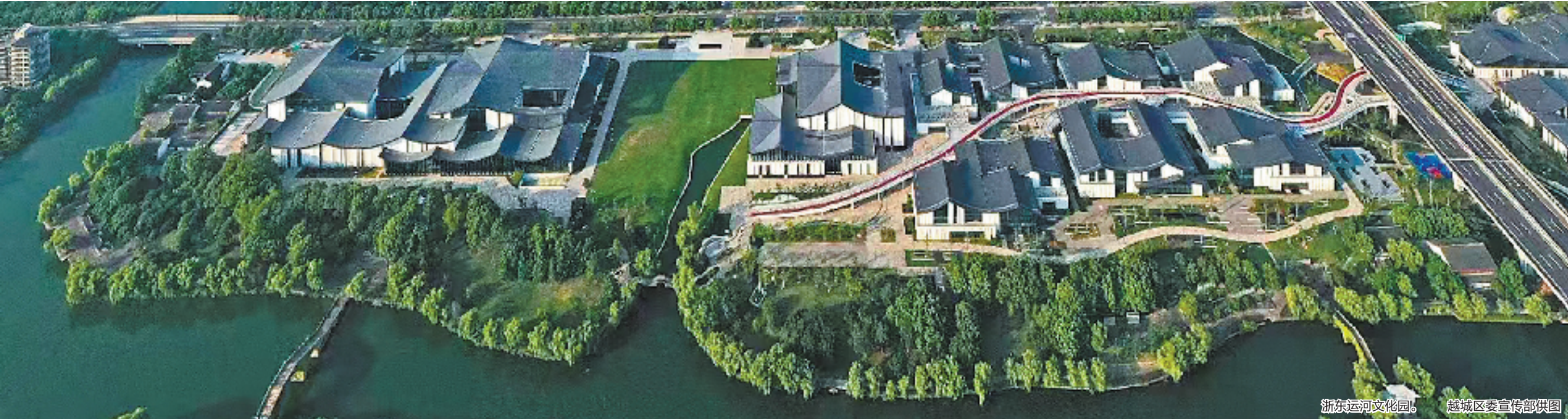
浙东运河文化园。越城区委宣传部供图