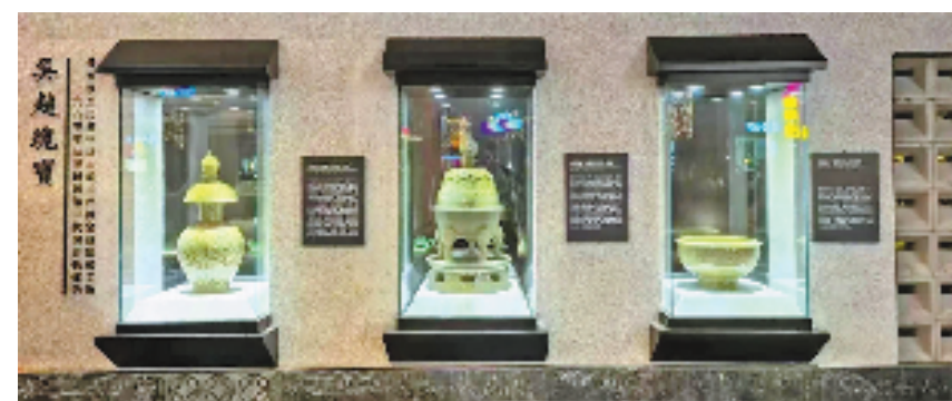
改造后的衣锦街一角。

在核心区周围,星罗棋布的历史遗存,对吴越文化形成了众星拱月之势,临安正全力探索“全域吴越”的融入路径。2023年以来,清凉峰镇、於潜镇、河桥镇相继获评省级历史文化名镇、省级千年古城复兴试点、省级文化强镇,建成乡村“吴越书房”、推出“吴越星舞台”展演点,为吴越文化在基层扎根打