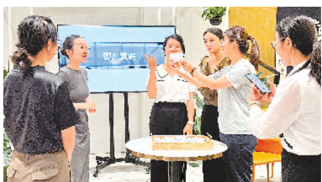
▲ 宁波人才发展集团青年午校手工制作课。

听完老师讲解,大家开始进行竹编画创作,先把不同颜色的竹篾按顺序铺在底板上,然后一挑一压地开始编织。看起来简单,真要动手做,还是有点复杂的,特别是如何做到竹篾颜色、距离均衡,边上是如何做到。大家一边做,一边向老师进行提问。