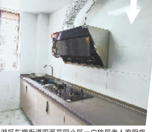
▲ 南湖区东栅街道双溪花园小区一户独居老人家厨房改造前后。