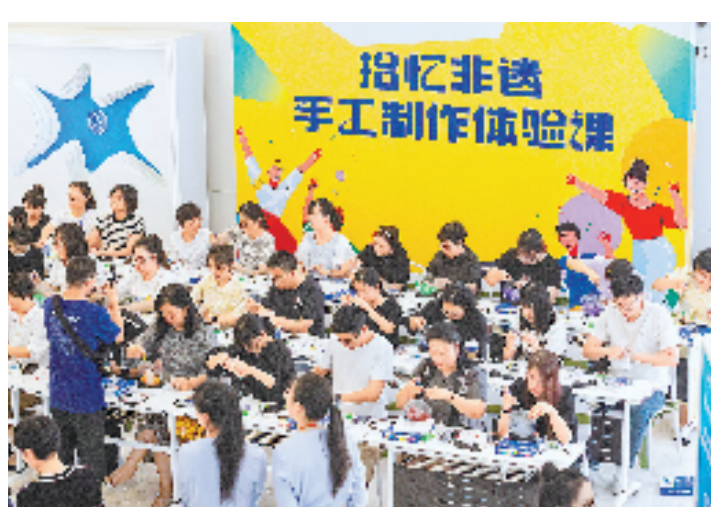
▲ 宁波人才之家青年午校的学员们正在进行即兴演讲训练。

“午校的出现,其实是市场对青年夜校运行模式的自我完善和有益补充。”江北区青年午校的发起单位、江北团区委负责人告诉记者,今年4月,他们依托江北区委组织部等多个部门及各级团组织