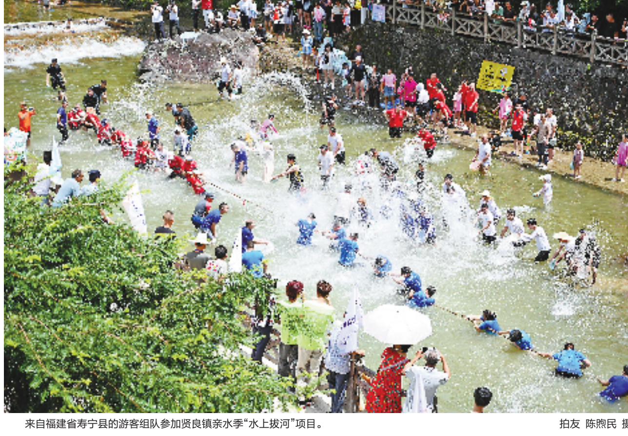
来自福建省寿宁县的游客组队参加贤良镇亲水季“水上拔河”项目。

贤良镇借助青山掩映的南阳溪打造亲水活动,是当地今年吸引游客的秘诀。贤良镇相关负责人介绍,他们主要策划了以““浇”个朋友”为主题的系列亲水活动,泼水竞赛、浑水摸鱼、水上滚筒、水上拔河等项目让贤良火爆出圈。“贤良亲水季”已成为浙闽边界一个响亮的金字招牌。