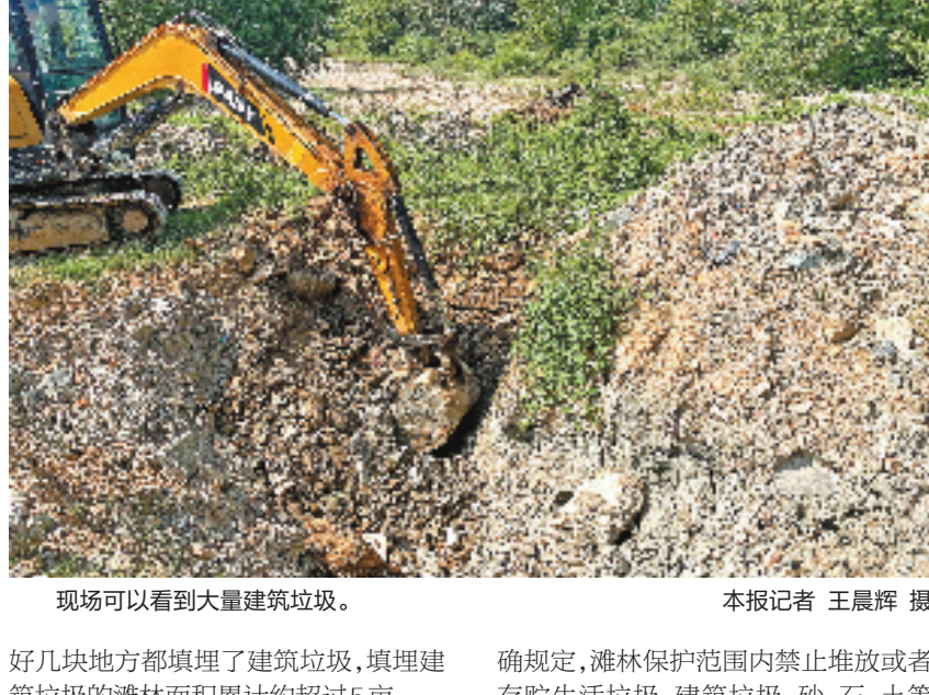
现场可以看到大量建筑垃圾。

汛季到来,永嘉雨水增多,显露在滩林表面的建筑垃圾越来越多,异味也越来越浓,很多垃圾还被冲到江里,污染了江水。村民发现这一片滩林里有