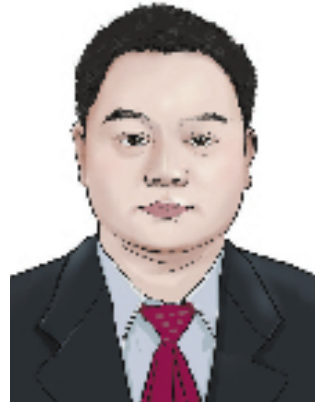
梅敬忠:中央党校(国家行政学院)教授、文史教研部原副主任