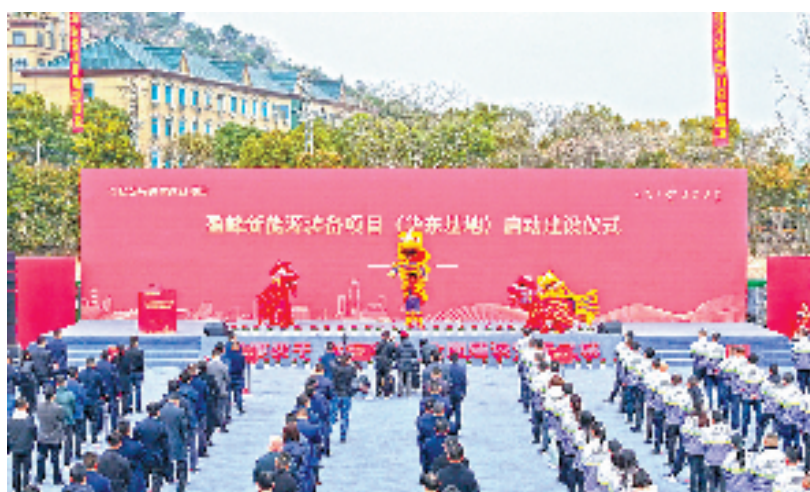
盈峰新能源装备项目(华东基地)启动建设