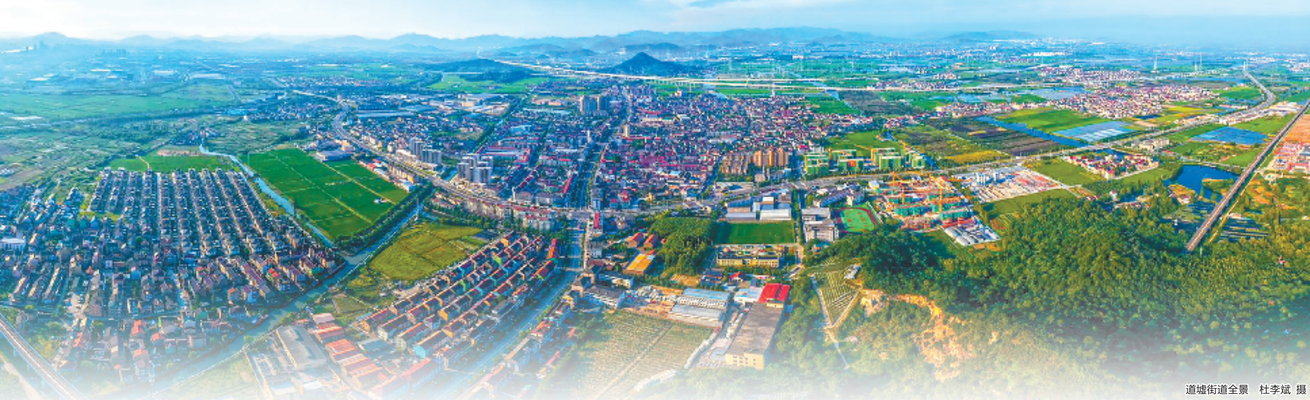
道墟街道全景

今年以来，道墟街道紧紧聚焦上虞“青春之城”建设的主战略，在“有道之墟·吾善同行”党建品牌的引领下，以抓深抓实“三支队伍”为关键，蓄势待发，全力向新，围绕“胆剑文化”起源地、“二次创业”主阵地、“三区融合”示范地的建设目标，以干部善育、万众善创、基层善治、文韵善承、共富善谋，持续唱响“二次创业”主旋律，重振“有道之墟”新辉煌。