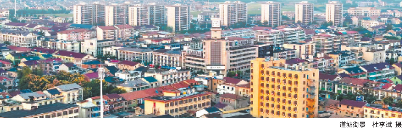
道墟街景