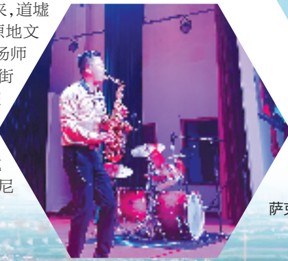
萨克斯专场演奏会