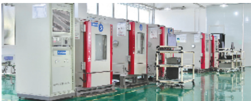
惯性导航系统生产企业机器设备升级换代

“总算吃下一颗定心丸，这笔资金真是及时雨。”该企业相关负责人激动地说，今年1月农行城东支行联合诸暨