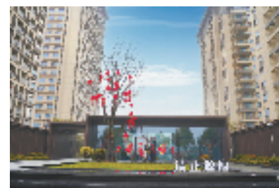
杭州市拱墅区首个人共有产权房项目“清正源府”

未来，农行杭州分行将加快推进金融自身高质量发展，扎实开展科技金融改革创新，全面提升金融产业综合竞争力。在金融强国建设的大场景中，打造一批标志性成果，为浙江深入实施“八八战略”，勇当先行者、谱写新篇章提供强有力支撑，以实际行动助力杭州市的科创金融改革试验区建设取得更大突破，为加快打造“创新活力之城”提供更大的金融力量，为全国金融改革提供“杭州实践”。