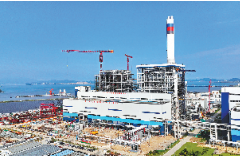
图为浙能六横电厂二期工程3号机组。

浙能六横电厂二期工程位于舟山六横岛,3号机组每年可发电55亿千瓦时,通过应用先进环保技术,每年可节约标准煤12万吨,减排二氧化碳30万吨。