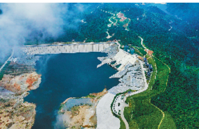
图为国网新源宁海抽水蓄能电站。

本报宁波6月18日电(记者 陈醉 胡静漪 贺元凯 通讯员 常国庆 尤才彬)6月18日,浙江省2024年迎峰度夏重点工程宁海抽水蓄能电站500千伏送出工程正式投运,标志着国网新源浙江宁海抽水蓄能电站正式接入浙江电网。