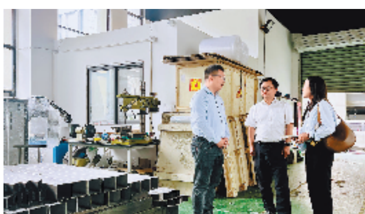
南京万洋众创城项目负责人(中)走访准备入驻的南京企业。