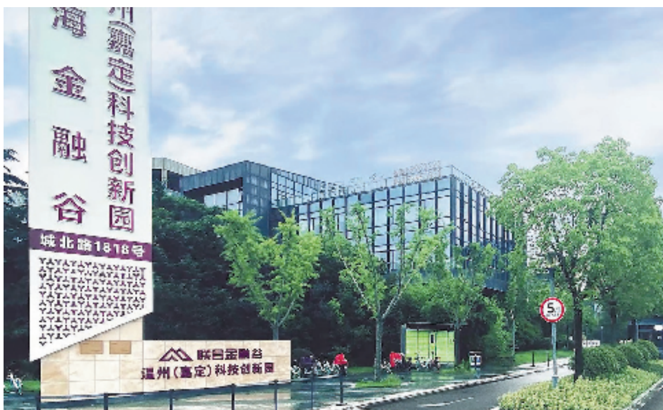
温州(嘉定)科技创新园。

靠着智能测试设备和智能自动化组装技术等一站式解决方案,公司一步成为戴尔、微软等世界500强企业的供应商,他也成了国家级专精特新“小巨人”企业的领头人。如今,企业八成订单来自国外,全球市场占有率近四成。走进公司一楼的企业文化展厅,墙上密密麻麻悬挂着各种专利证书,目前企业拥有近百项专利。