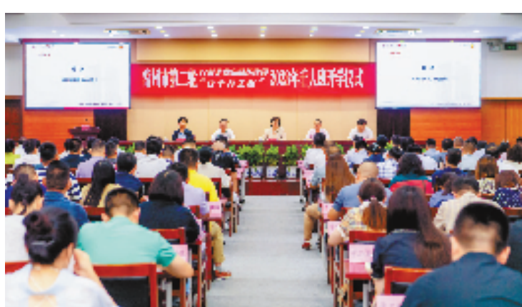
常州举办民营企业队伍建设“百千万工程”。

(本报记者 徐健 解亮 周琳子 谢甜泉 王艳琼 叶小西 应志彭 汪子芳 赵璋璋 殷诚聪 张银燕 刘琨 孙坤 尤建明 项锐 见习记者 奥伦赛)