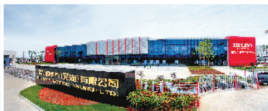
德力西电气芜湖生产基地。