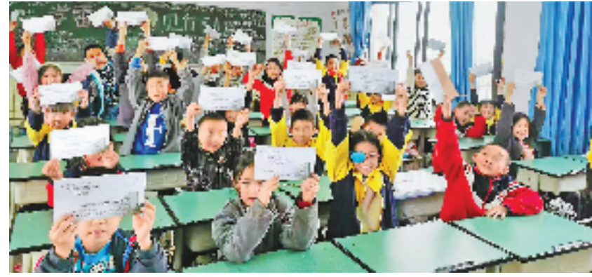
四川南充市嘉陵区之江小学的同学们展示和浙江台州临海市哲商小学学生的书信。