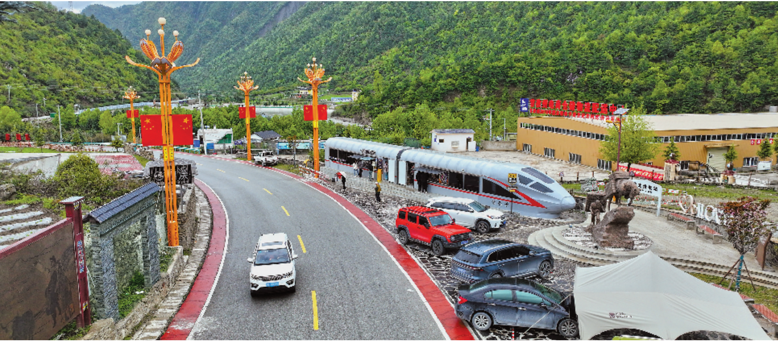
海拔3000多米的四川康定市雅拉乡王母村,在浙江的帮扶下,打造了以“康定溜溜调”情歌为主题的村落。图为“康定情歌号”咖啡驿站。

浙江始终牢记习近平总书记殷殷嘱托,坚决扛起深化东西部协作和对口工作的使命担当,聚力提升对口工作质效,坚持优势互补共赢发展,进一步加强劳务协作、深化产业合作、开展组团帮扶、深挖能源潜力,推动两省合作迈向更宽领域、更深层次、更高水平,努力打造更多认可度高、复制性强、效率高、群众受益的标志性成果,在奋进中国式现代化新征程上携手谱写浙川合作新篇章,为全国大局作出新的更大贡献。