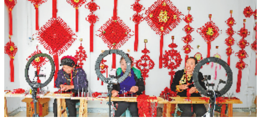
在浙江省援建车间——四川丹巴县来料加工创业基地,“藏家绣娘”们坐在直播镜头前,一个个红色中国结在她们手中逐渐成型。