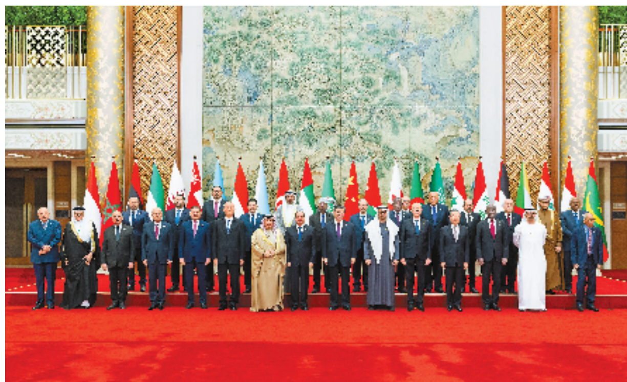
5月30日上午,国家主席习近平在北京钓鱼台国宾馆出席中阿合作论坛第十届部长级会议开幕式并发表主旨讲话。这是习近平同巴林国王哈马德、埃及总统塞西、突尼斯总统赛义德、阿联酋总统穆罕默德、阿盟秘书长盖特以及22位阿拉伯国家代表团团长集体合影。