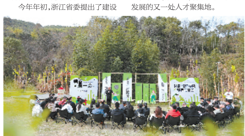
临海市沿江镇启动“筑匠计划”

不久前,共富“新”学院帮农助富团再度升级,沿江镇与临海南部片区三镇联合开展党建联建,在原有种植能手、土专家、农创客等帮农客小分队的基礎上,引入该镇青年“沿”学员成员。建设人才队伍的举措还在不断探索,眼下,沿江镇人才服务驿站正在装修,成立后,将成为共谋沿江发展的又一处人才聚集地。