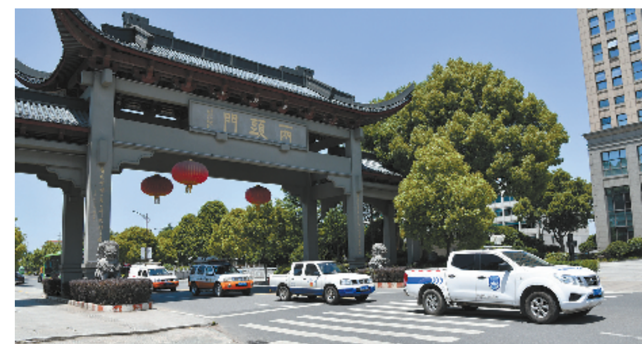
“执法蓝”为“富乐嵊州”赋能助跑

“全域美丽不仅是一个环境美化的项目,更是一个全方位振兴乡村的战略。”嵊州市综合行政执法局相关负责人说。嵊州市致力于打造本土品牌,通过深挖一批有风光、有文化、有产业的精品乡村,大力实施产业集聚化和乡村振兴战略,助力“富乐嵊州”建设,切实让环境“净”起来、百姓生活“甜”起来。