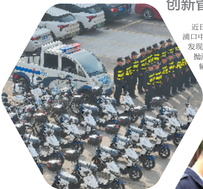
加强队伍建设 提升执法效能

队伍工作积极性和创造力。对此,嵊州市建立了一套由“全域共美丽”行动办公室考核九大专班、九大专班考核乡镇(街道)、乡镇(街道)参照市级九大专班组织架构,健全主要领导亲自抓、分管领导具体抓、业务干部一线抓的责任体系,构建横向到边纵向到底的组织网络。此外,加强乡镇(街道)与专班、重要处置部门、共创共建部门的上下联通,做好各条线之间的协同配合,变“条块分治”为“协同治理”,变“单打独斗”为“多方联动”。