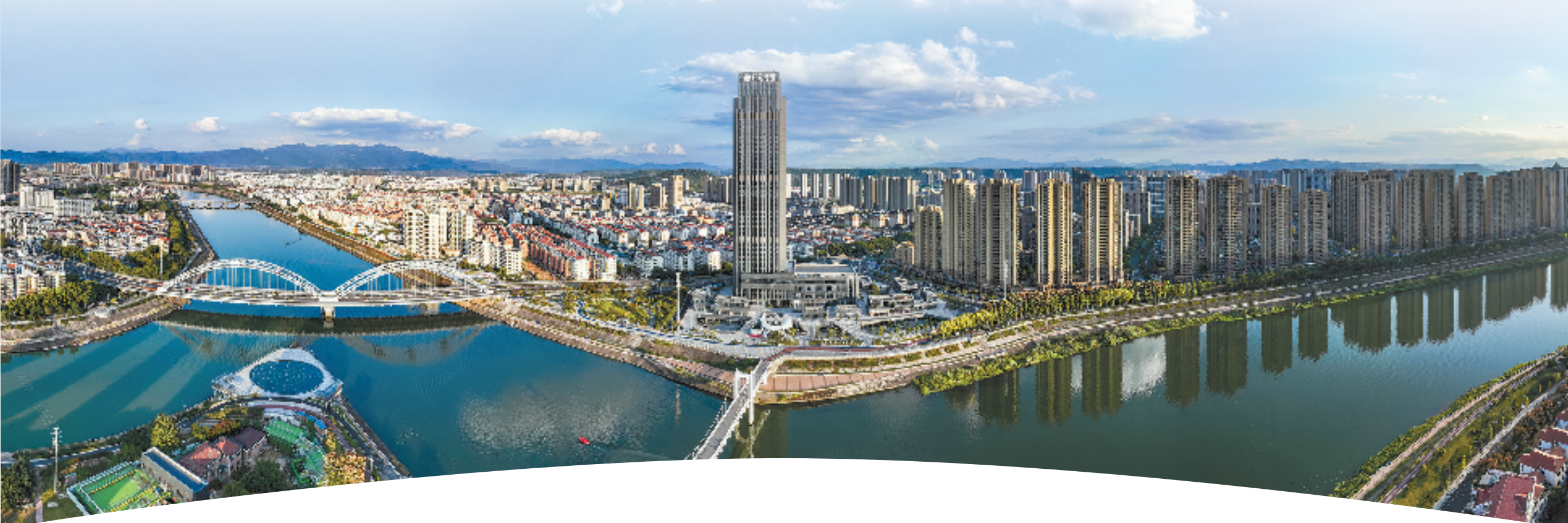
俯瞰嵊州

特别是今年以来,嵊州市深入实施“八八战略”,践行“绿水青山就是金山银山”理念,加强“三支队伍”建设,以“城乡精治理、品质大提升、全域共美丽”为主题,把握“精致”和“品质”这两个关键词,进一步打磨细节、放大特色,把嵊州打造成为山水人与城业相融、现代化与江南韵共存的宜居宜业典范,努力为推进美丽浙江建设、描绘“富乐嵊州”新蓝图再添新彩。