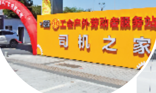
衢州市汇邦汽车驿站入口处。