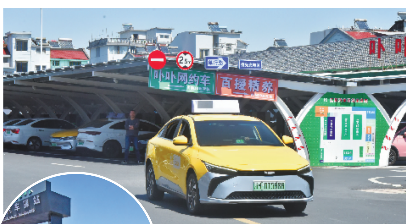
充好电的出租车驶离衢州市汇邦汽车驿站。

充电的半小时司机怎么度过?在这个近26个篮球场大的充电站里,我们跟着人流四处打卡。有维修需求的司机