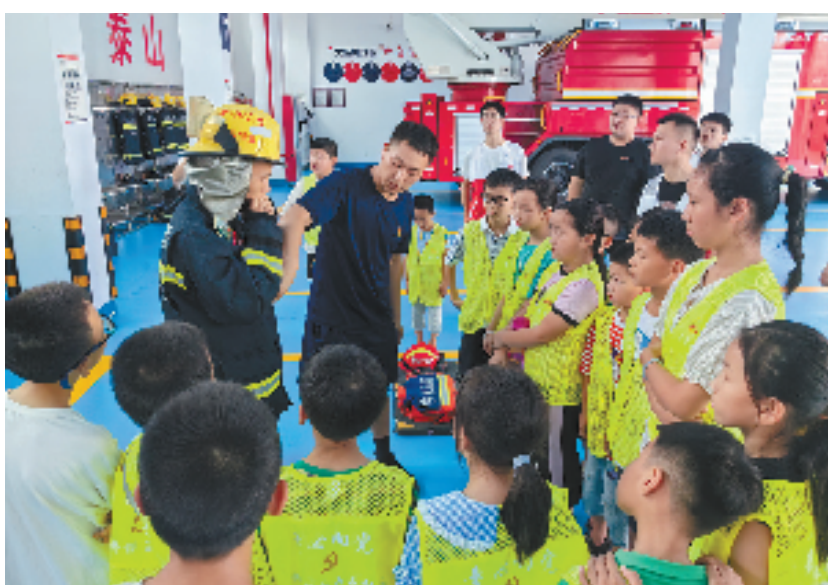
玉龙社区公益暑托班的孩子到婺城区消防救援大队开展消防安全主题活动

眼下，白龙桥镇正大力推进现代社区建设，切实提升网格化管理精细度，以“点点星火”带动“幸福燎原”，坚持党建引领，形成了华电新村社区“小巷银龄互助队”、金奥社区“邻里筑家、情暖金秋”、玉龙社区“公益暑托班”等