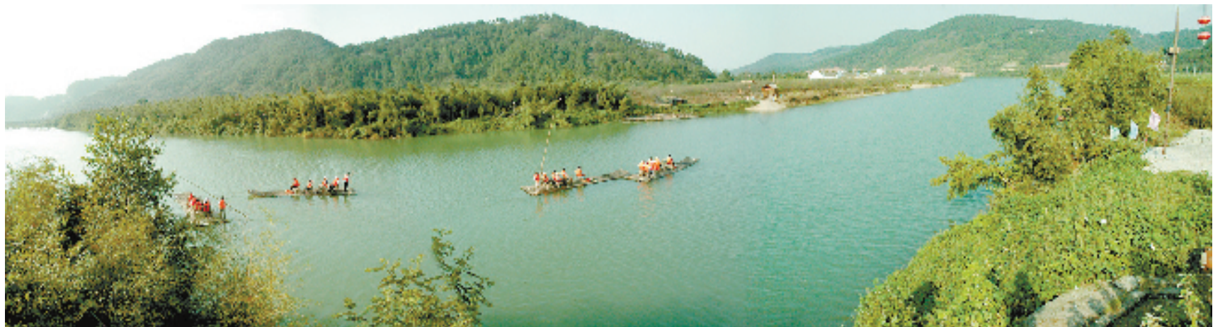
坐竹筏畅享剡溪美景

截至目前,嵊州市共有全国劳模8人,部级劳模28人,省级劳模23人,省先进生产(工作)者9人,绍兴市级劳模58人,嵊州市级劳模104人。 “在新质生产力的发展进程中,高素质干部队伍、高水平创新型人才和企业家队伍、高素质劳动者队伍‘三支队伍’都有着特殊的地位,唯有融会贯通、协同作战,才能更有效地应对对‘人口红利’向‘人才红利’转型的深远变革。”嵊州市总工会相关负责人说。 为加快培育新时代产业工人队伍,嵊州市推动职工阵地升级,满足更多职工文化需求;开展“名师带徒”活动,推动产业工人队伍整体素质和技能水平提升;举办涵盖技术