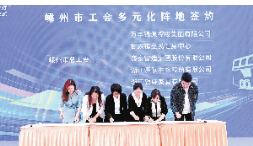
工会多元化阵地签约

初,嵊州市围绕全面加强“三支队伍”建设要求,聚焦“服务阵地强”,新建服务职工综合体,努力提升工会组织综合服务能力。 据悉,新建的服务职工综合体功能将进行全新布局,以劳模工匠为教本,建设劳模工匠工作室,开设专业技术培训课堂、劳模工匠直播间,带动技术的传承和精神的弘扬;以窗口式服务方便职工群众,建设职工服务中心,开展“线上+线下”综合性全环节服务体验;打造文体活动阵地,包括越剧、小笼包制作等地方特色文化和各类运动场馆,以及配套慢咖、健身餐等新业态的补充,让“工”味服务更有温度。 在此基础上,开设“嵊州匠心”视频号,利用爱嵊州视频号、融媒体视频号、抖音等第三方平台以及城市电子屏幕、城乡公交车电视等进行展播,全方位扩大嵊州匠心故事的宣传范围,提升社会影响力。