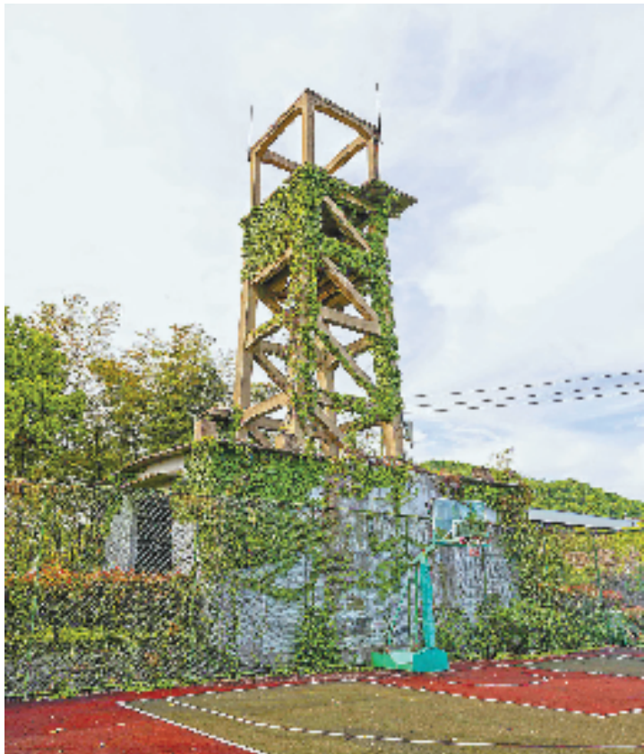
昔日的矿井周围修建了现代篮球场,新旧对比,见证着时代更迭。