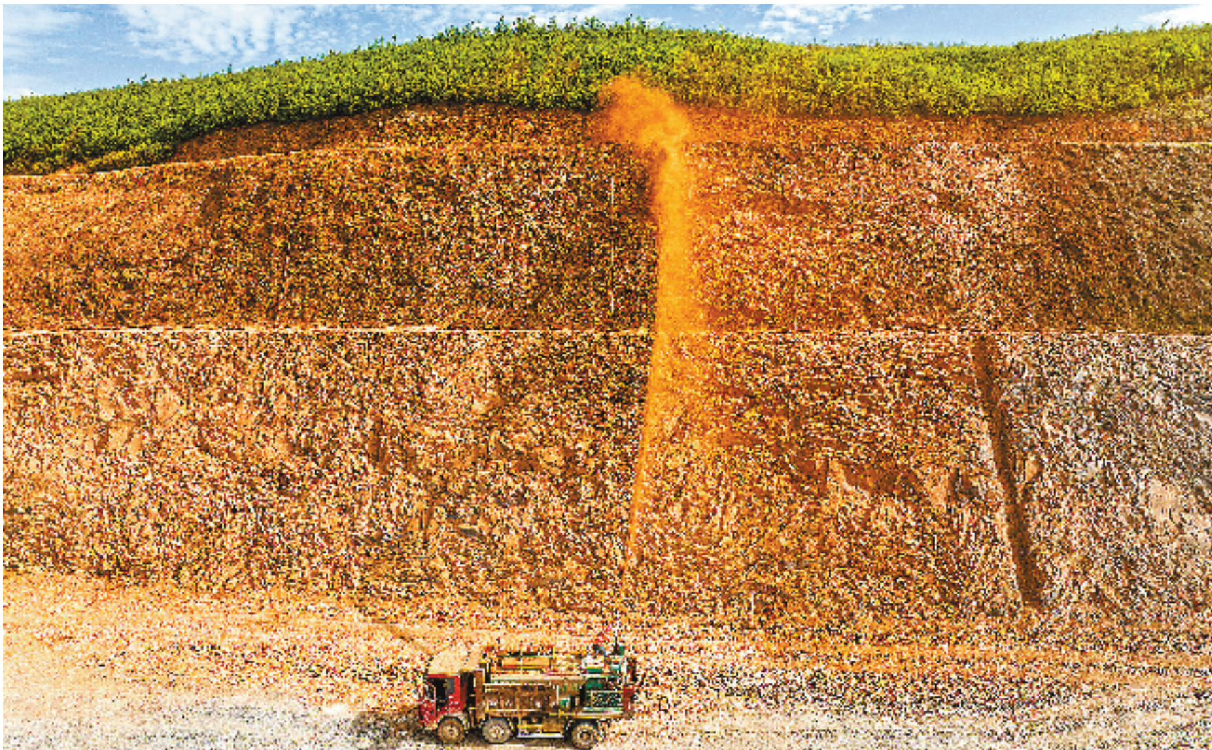
煤山镇干井湾矿区,工人正在往矿山岩壁喷涂带有植物种子的复合泥,生态修复废弃矿山。