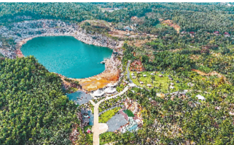
矿坑露营基地吸引游客前来打卡。