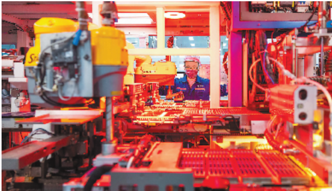
煤山镇一企业内,机械臂正在生产太阳能光伏板。