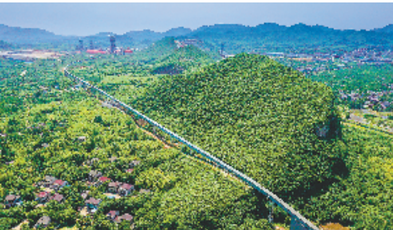
空中走廊水泥熟料输送带横跨山野。