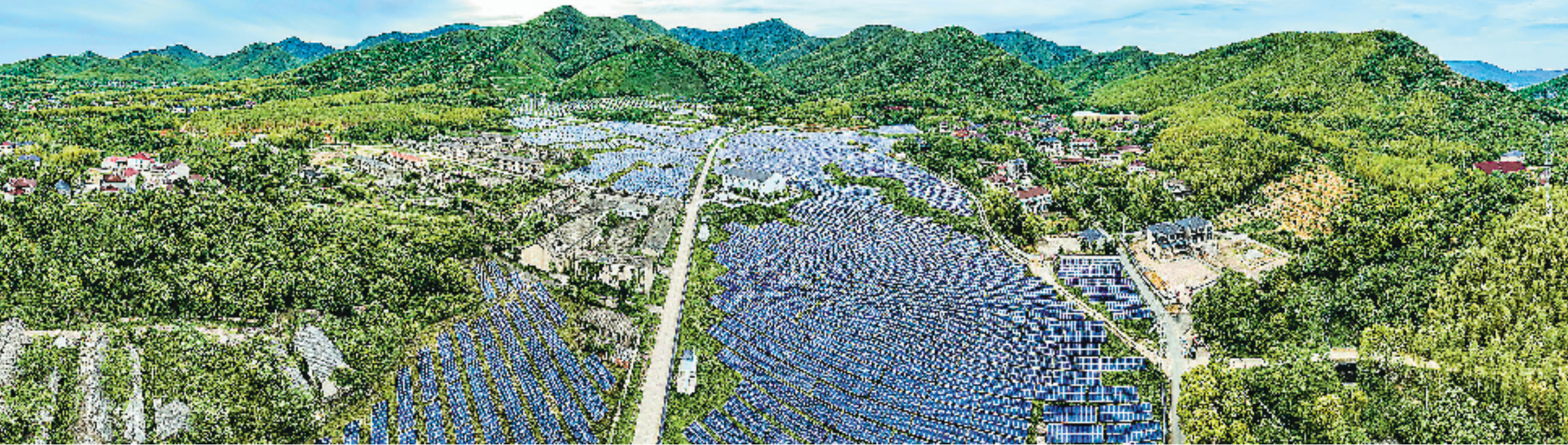
煤山镇东风村,昔日的长广煤矿旧址如今变成太阳能光伏基地。