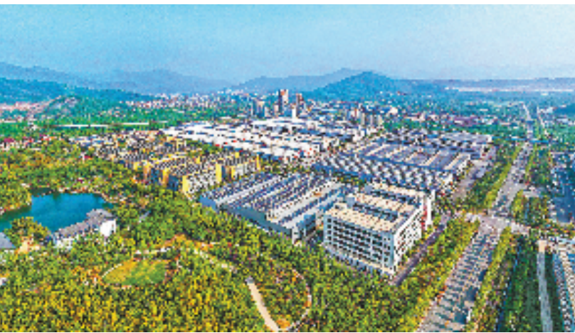
俯瞰建在废弃矿山上的国家级绿色制造产业园。