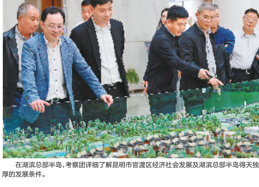
在湖滨总部半岛,考察团详细了解昆明市官渡区经济社会发展及湖滨总部半岛得天独厚的发展条件。