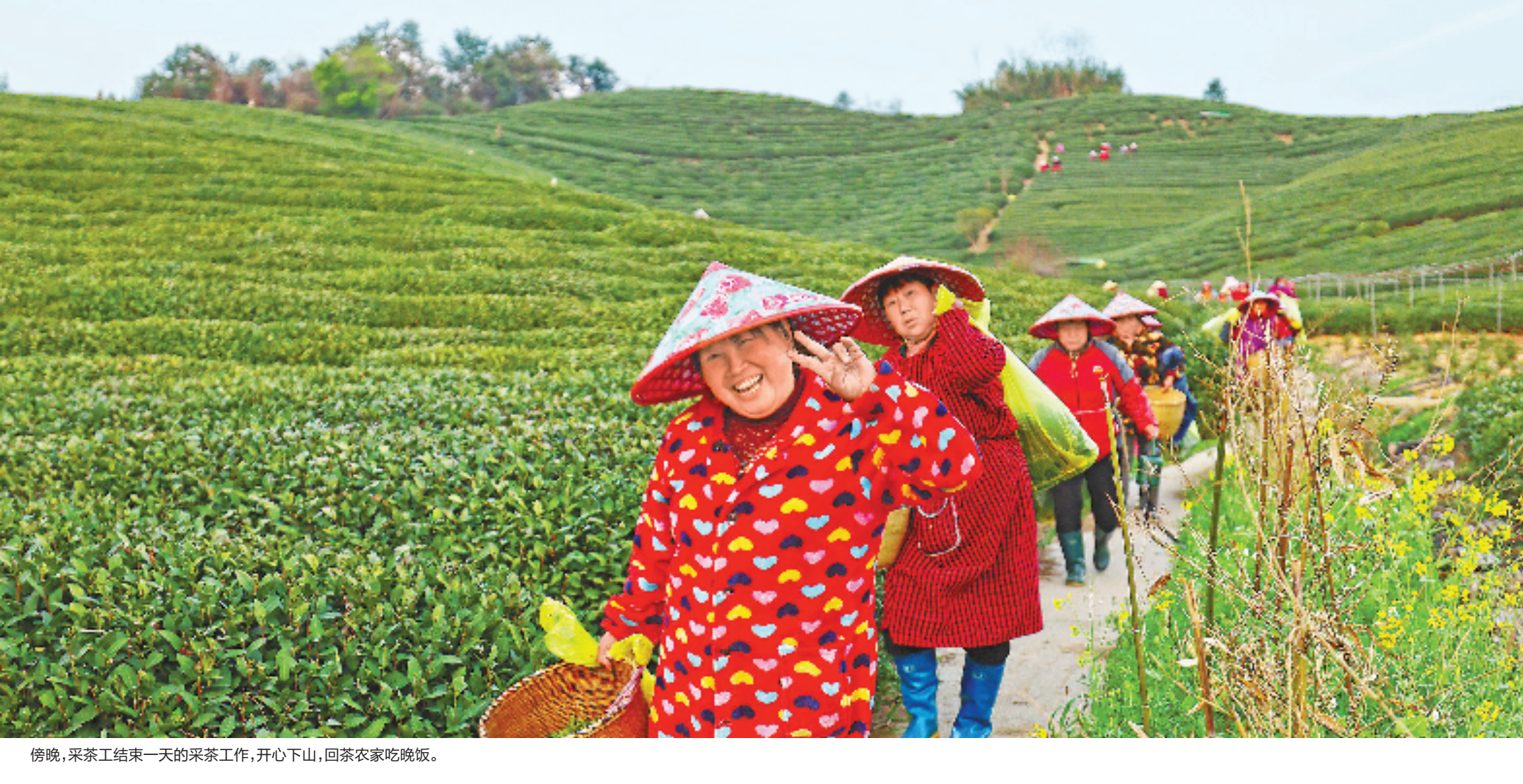
傍晚,采茶工结束一天的采茶工作,开心下山,回茶农家吃晚饭。