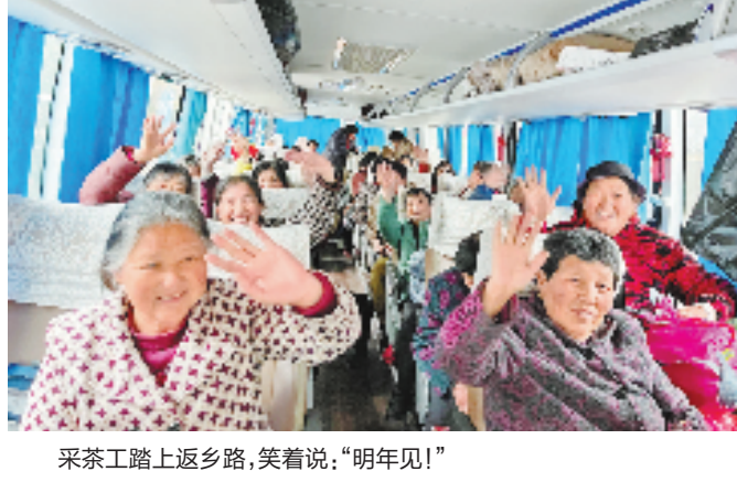
采茶工踏上返乡路,笑着说:“明年见!”