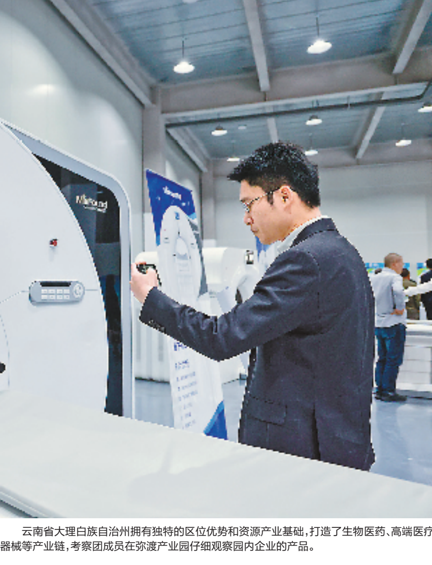
云南省大理白族自治州拥有独特的区位优势和资源产业基础,打造了生物医药、高端医疗器械等产业链,考察团成员在弥渡产业园仔细观察园内企业的产品。