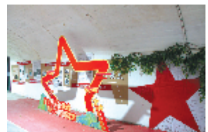
人防设施文化长廊

坚持共建、共享、可持续发展理念,普陀区国动办冲锋、打头阵,以高质量打造人防服务体系为目标,在“勇当先行者、谱写新篇章”的道路上砥砺前行。