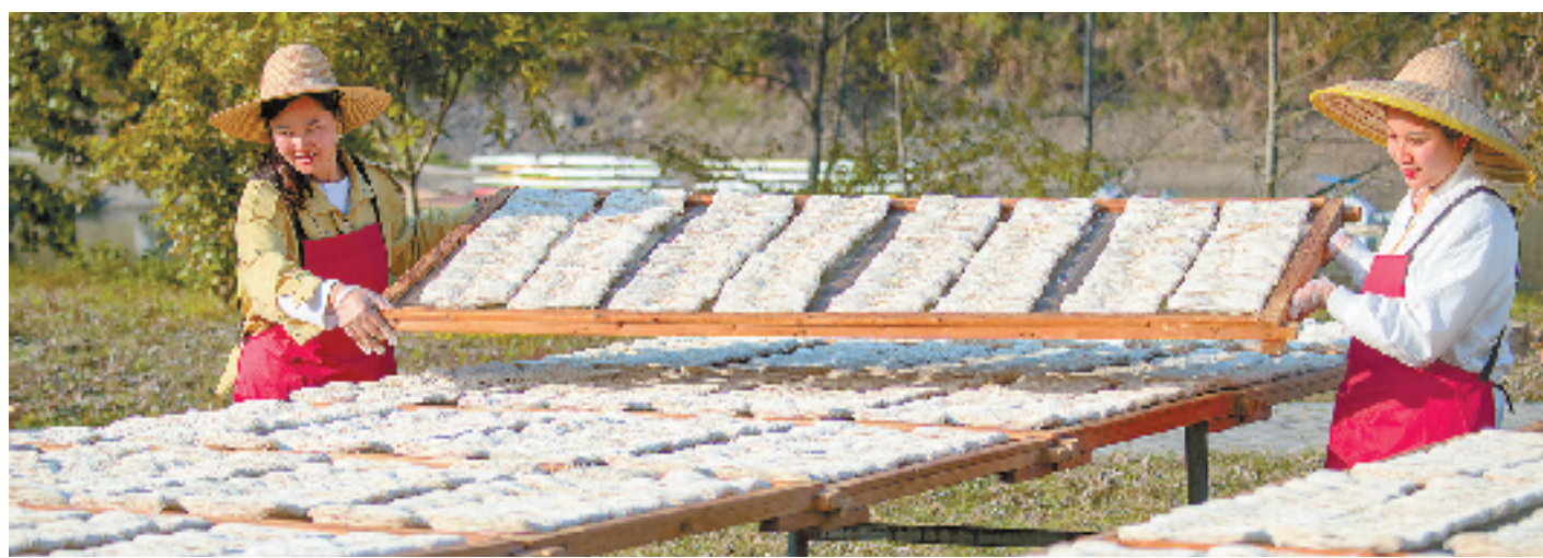
好山好水出好面,好面带来好光景。