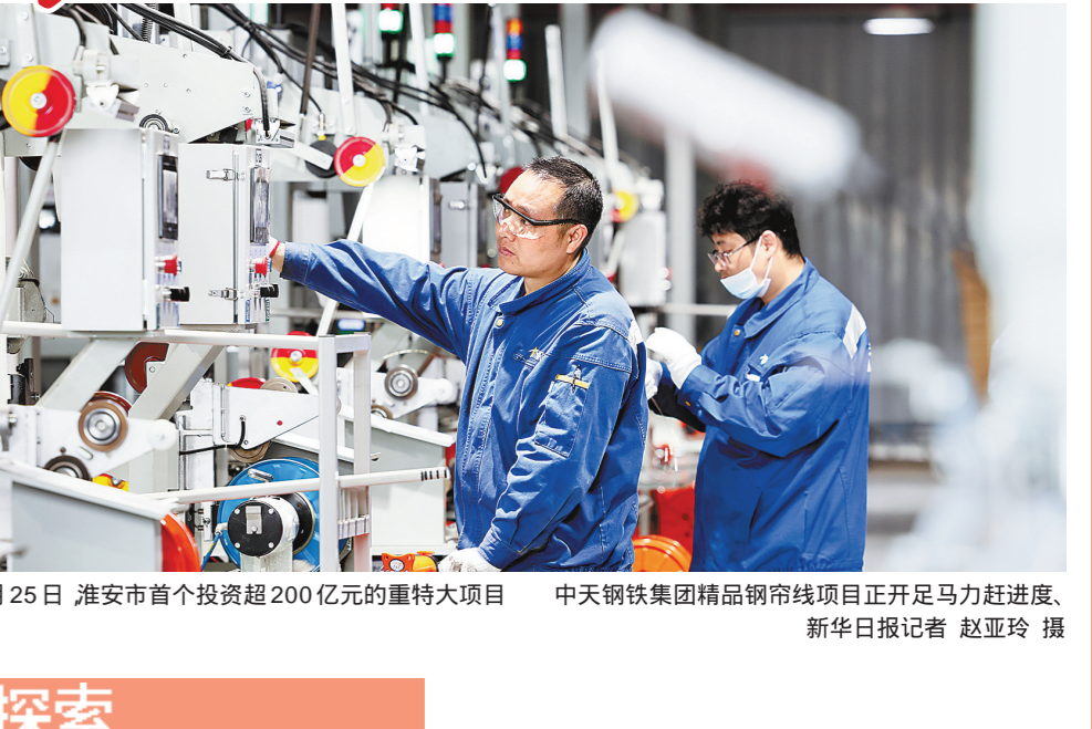
2023年4月25日,淮安市首个投资超200亿元的重特大项目——中天钢铁集团精品钢帘线项目正开足马力赶进度、抓生产。