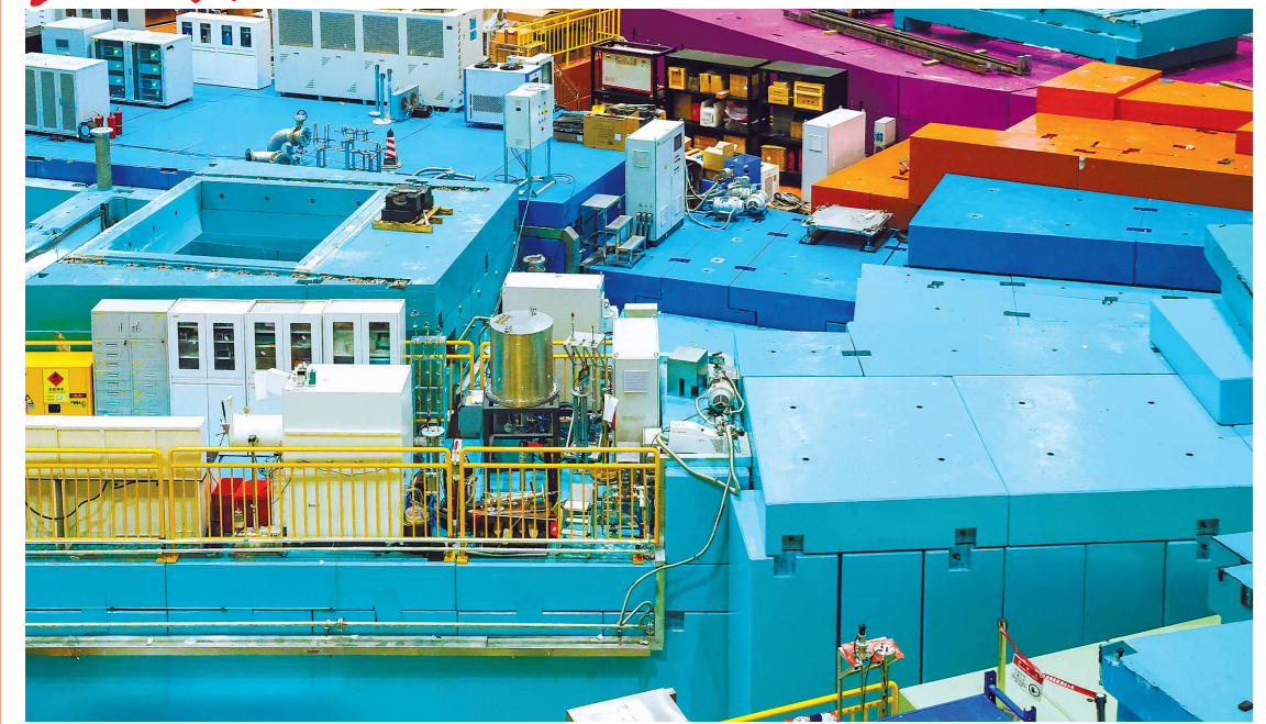
正在建设和中的东莞中国散裂中子源中子谱仪(2023年7月18日摄)。中子谱仪是探测物质微观结构和动力学行为的实验终端。