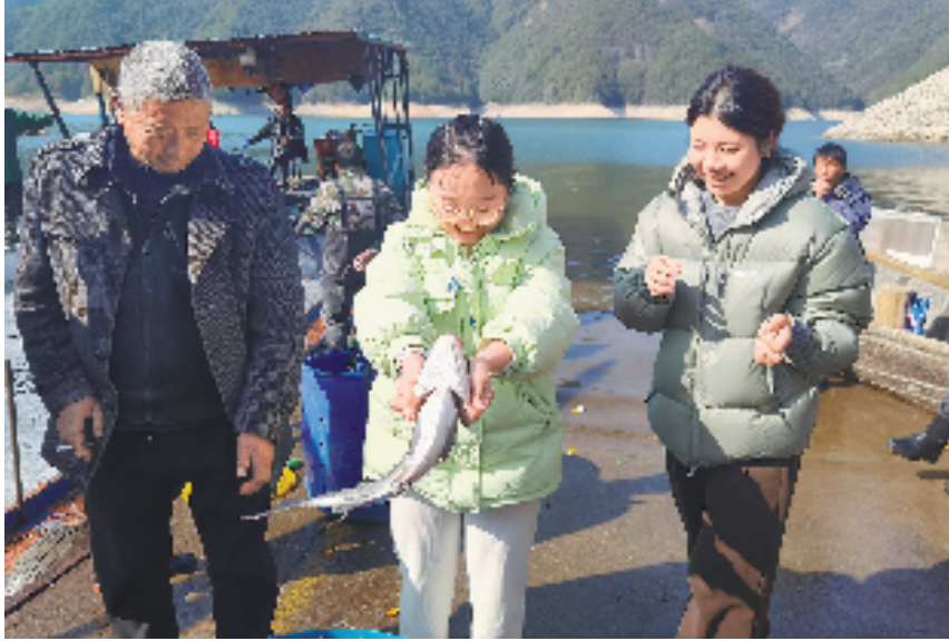
本报记者(中)捉到一条大鲢鱼。