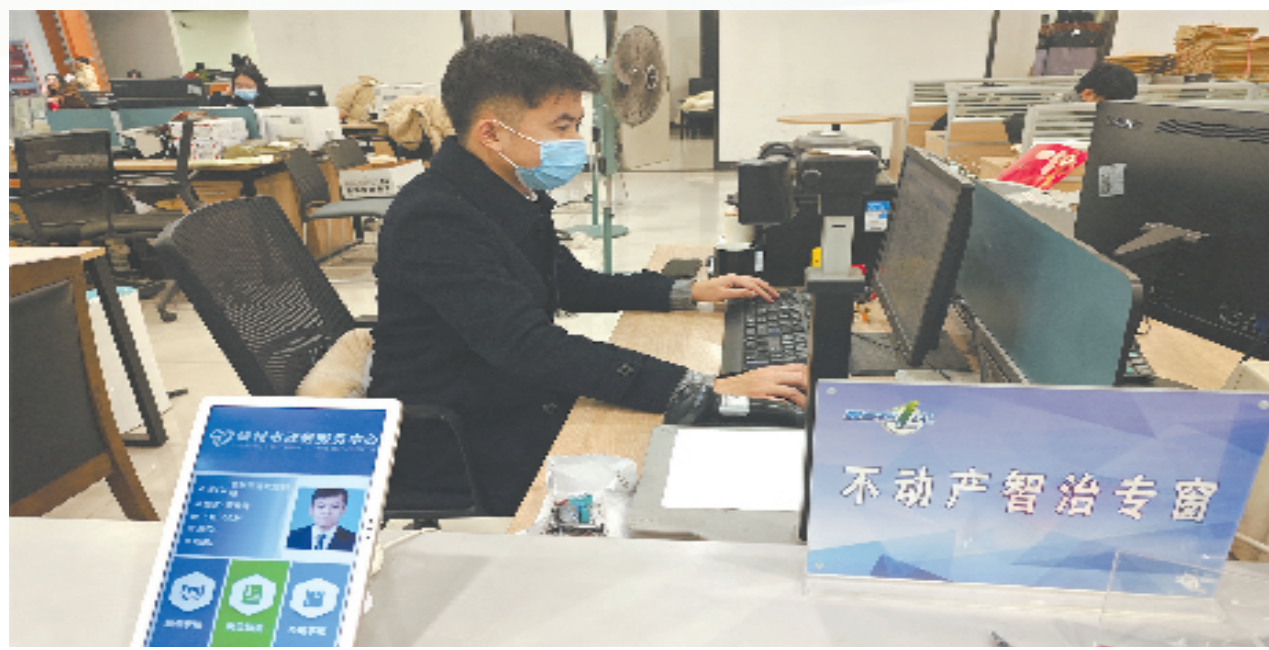
嵊州市不动产登记窗口为群众免证办理房产登记业务