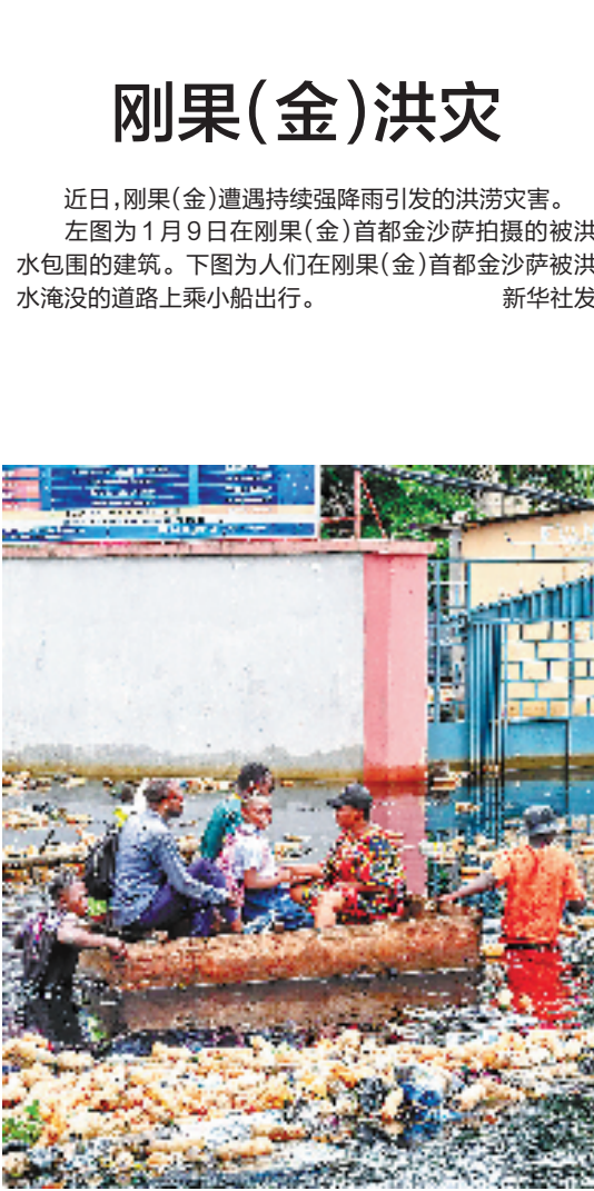
近日,刚果(金)遭遇持续强降雨引发的洪涝灾害。 左图为1月9日在刚果(金)首都金沙萨拍摄的被洪水包围的建筑。下图为人们在刚果(金)首都金沙萨被洪水淹没的道路上乘小船出行。